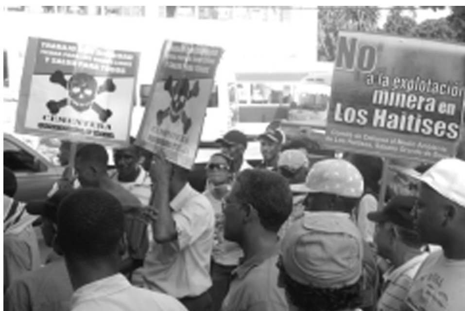
Protesta 29 de mayo, en el parque La Lira en Santo Domingo