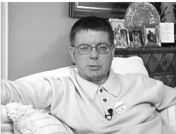
Dr. George Tiller

No hay duda de que la muerte de Tiller es un asesinato político. Mientras, ese crimen horrible, no