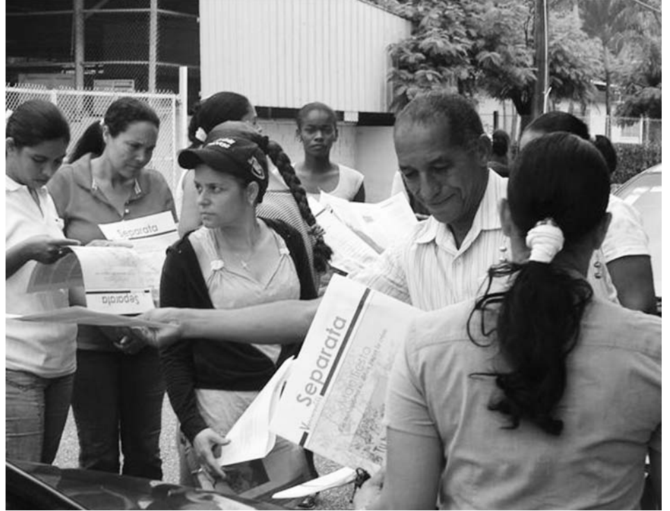
Trabajadoras (es) en vigilia en área del comedor