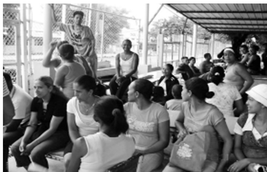
Vigilia de trabajadoras/es en la empresa Loadway en Bonao

Secretaría de Trabajo se confabula contra trabajadoras Loadway en Bonao