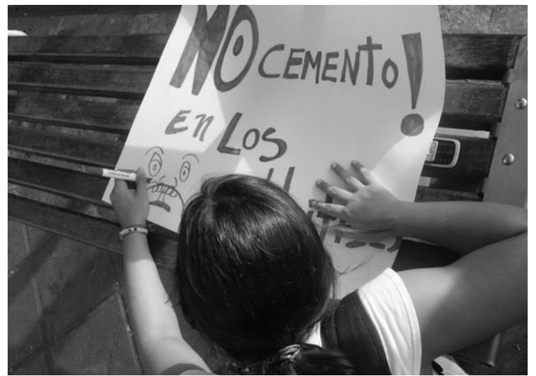
Protesta parque La Lira

zaciones internacionales que se identifican con la protección de los recursos naturales.