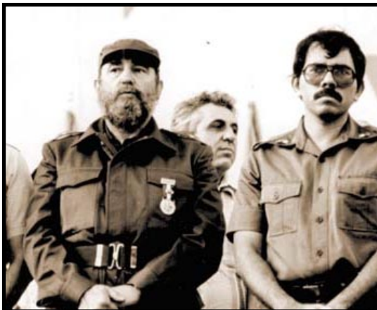
Los años de la Revolución, son sólo fotos en un álbum para la dirección del FSLN

En la historia del sandinismo deben analizarse tres etapas. La primera, (1961-1979) la de su nacimiento como un acto de rebeldía de la clase media contra la dictadura somocista, especialmente de los sectores estudiantiles radicalizados. Fue la etapa heroica, de la guerrilla valiente que se enfrentaba con pistolas a los