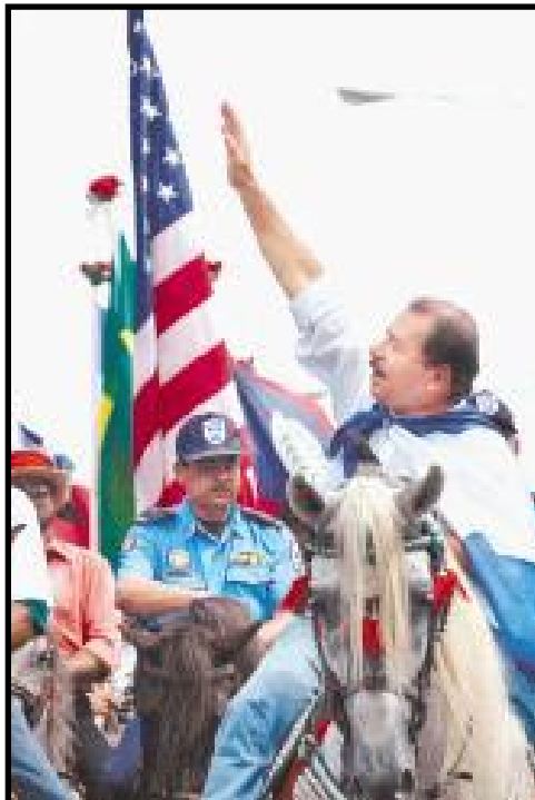
Daniel Ortega, el sempiterno candidato del FSLN, entró a caballo a la Plaza.

Arnoldo Alemán ascendió a la presidencia enarbolando la bandera del antisandinismo, pero una vez que estaba en el poder se vio forzado a negociar con ellos. El discurso populista de izquierda para las masas, pero la dirigencia sandinista no tuvo el menor rubor de pactar con Alemán las reformas a la Constitución en el año 2000, y repartirse las instituciones del Estado, en lo que se ha denominado “el pacto”.