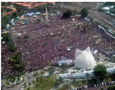
XXVII Aniversario de la Revolución nicaragüense.- Nicaragua