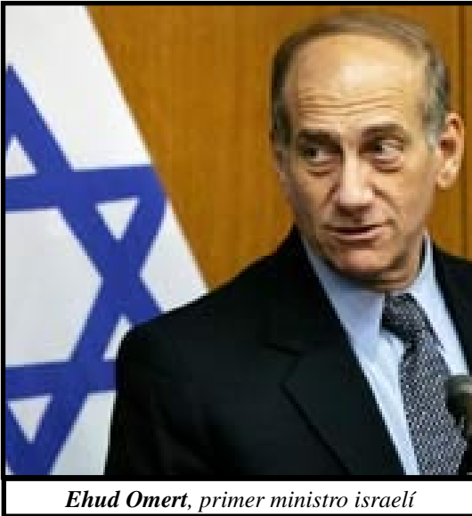
Ehud Omert, primer ministro israelí

Ante tal panorama el imperialismo yanqui y europeo han impulsado una política de división, primero buscaron que la conformación del ejército y fuerzas de seguridad palestinas fuera una atribución del poder ejecutivo (Al Fatah),