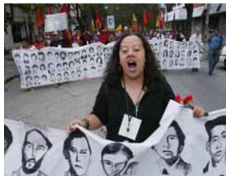
Protesta anti-bélica.- Guatemala