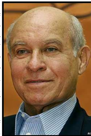
Herty Lewites (q.e.p.d.) ex candidato presidencial por el MRS

Las posibilidades de triunfo del MRS son hoy mas remotas que nunca, y sin duda tiende a la baja con el paso del tiempo. Aún con vida Lewites la última encuesta señalaba un derrumbe de 4 puntos en las preferencias alcanzando un 19%; hoy solo llegan a un 15%. Incluso con el gran esfuerzo de la burguesía y sus medios de levantarles el perfil para golpear “por el flanco” al FSLN.