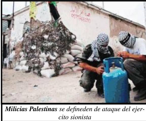
Milicias Palestinas se definen de ataque del ejercito sionista

de Cisjordania vive bajo el umbral de la pobreza, en lo que va del año 4,000 palestinos han resultado muertos por ataques del ejército de ocupación israelí (y colonos), asimismo Israel ha hecho prisioneros a unos 9,000, han demolido unas 8,000 viviendas, ha confiscado miles de terrenos (Informe de la ONU sobre Palestina 2006). Lo único visible es