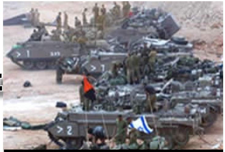
Ejército sionista invadiendo El Líbano.- Internacional