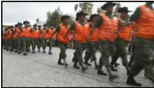
Marcha del Ejército de Guatemala (30 de junio)

militarizante, es la intervención cada vez mayor del ejército en las tareas de combate a la delincuencia y seguridad ciudadana a la par de la Policía Nacional Civil. Después de haber reducido el número de efectivos a la mitad como resultado los Acuerdos de Paz, en febrero de este año el ejército anunció la contratación de tres mil hombres para apoyar a la PNC en los patrullajes por la ciudad; los nuevos reclutas serían escogidos entre los ex-soldados, ex-reservistas y egresados del instituto militar Adolfo Hall. Al final fueron contratados dos