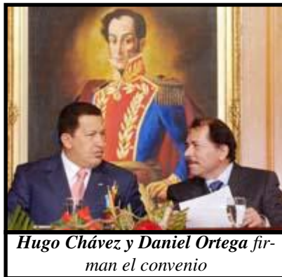
Hugo Chávez y Daniel Ortega firman el convenio