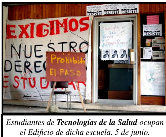
Estudiantes de Tecnologías de la Salud ocupan el Edificio de dicha escuela. 5 de junio.