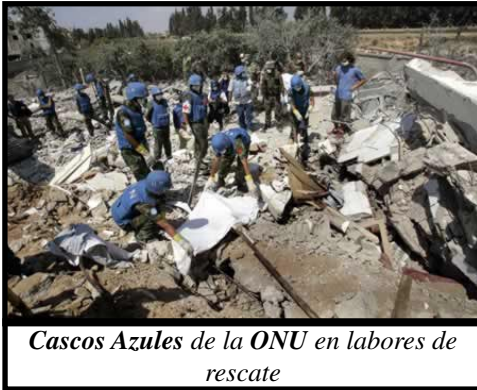
Cascos Azules de la ONU en labores de rescate

poder, aunque no sea un Estado. Hamas, en cambio, encabeza el gobierno de la ANP, el embrión del estado palestino. Siria e Irán son dos Estados, enemigos acérrimos de Israel, que forman un frente de lucha contra el sionismo. La conjunción de estas fuerzas puede representar un peligro para la existencia del sionismo, y por ello el ejercito israelita, apoyado por el imperialismo norteamericano, con la complicidad cínica del imperialismo europeo, se ha adelantado a asestar golpes militares en dos frentes, priorizando los ataques sobre Hizbollah.