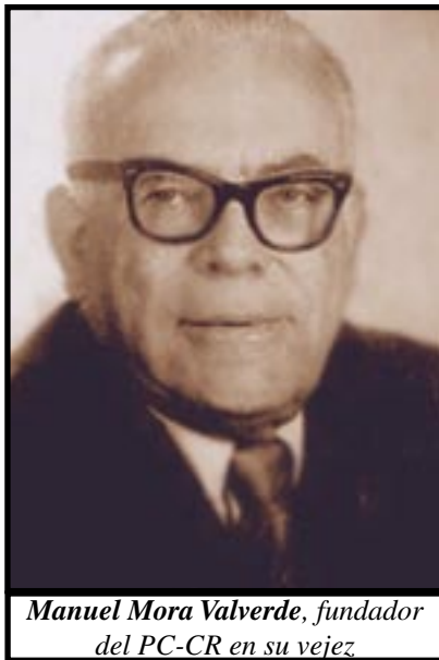
Manuel Mora Valverde, fundador del PC-CR en su vejez.

A setenta y cinco años de su fundación, el otrora poderoso Partido Comunista de Costa Rica (PCCR) que llegó a tener en su filas a miles de militantes y simpatizantes, actualmente después de varias divisiones se ha visto reducido a una pequeña agrupación (Partido Vanguardia Popular) como fruto entre otros factores, de las políticas estalinistas y reformistas que sostuvieron durante décadas muchos de sus principales dirigentes. Consideramos que es necesario que las nuevas generaciones de hombres y mujeres luchadoras en Centroamérica, conozcan los éxitos que tuvo el PCCR en su momento, pero más importante aún, que tengan conciencia de lo nocivo que puede llegar a ser la implementación del reformismo dentro de las filas de cualquier movimiento que se considere revolucionario.