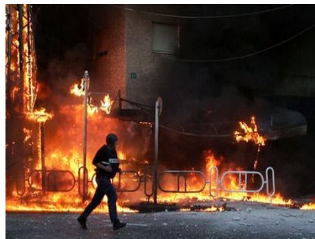
Palestina en llamas.- Internacional