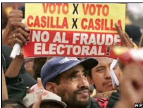
¿Cuales son las lecciones de las elecciones mexicanas?.-Editorial