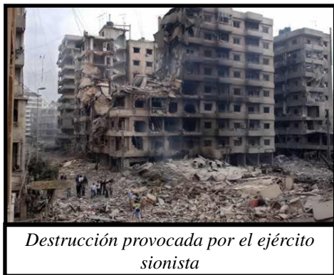
Destrucción provocada por el ejército sionista

Hezbollah ha combatido al Ejército de Israel y a sus aliados del Ejército del