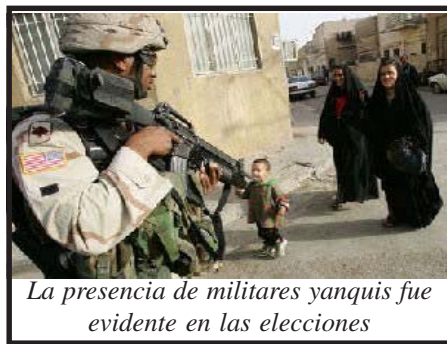
La presencia de militares yanquis fue evidente en las elecciones

G.W. Bush sabe que se ha anotado un triunfo en su política de democratización pro imperialista de medio oriente. “El mundo está escuchando la voz de la libertad