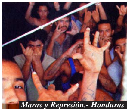
Maras y Represión.- Honduras