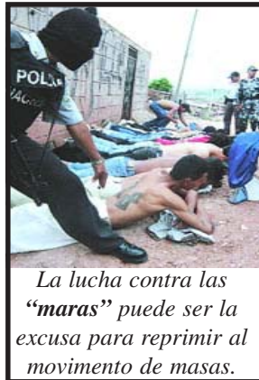
La lucha contra las “maras” puede ser la excusa para reprimir al movimiento de masas.

El 2004 fue un año de crecimiento económico para Centroamérica, la región de conjunto creció un 3,2%. Este crecimiento tuvo como “motores”: el crecimiento de las exportaciones hacia Estados Unidos, las remesas familiares, el turismo y la subida en los precios del café. La proyección para el 2005 es que la economía seguirá creciendo. Evidentemente este crecimiento beneficia fundamentalmente a los empresarios exportadores o turísticos y a los grupos vinculados a estas actividades. En términos generales los bajos salarios, el desempleo y la migración mantienen su nivel. El proyecto fundamental que tienen los gobiernos del área para este año es la ratificación