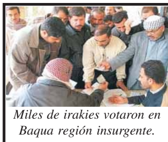
Miles de irakíes votaron en Baqua región insurgente.