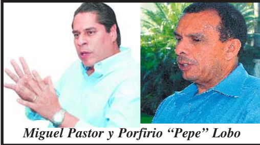
Miguel Pastor y Porfirio “Pepe” Lobo

Pero además esta figura delictiva ha comenzado a ser aplicado a otros sujetos sociales distintos de las maras o de los delincuentes tradicionales, tal como fue la acusación de “asociación