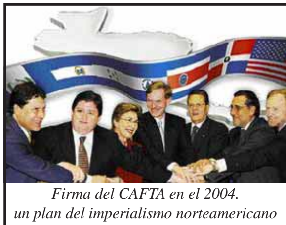
Firma del CAFTA en el 2004. un plan del imperialismo norteamericano

CAFTA y las contrarreformas que este implica. El caso salvadoreño señala como, las direcciones burocráticas del movimiento de masas van a impedir que los sectores populares realicen una lucha fuerte contra este Tratado. La construcción de una nueva dirección centroamericanista en el movimiento popular es una tarea planteada de manera inmediata.