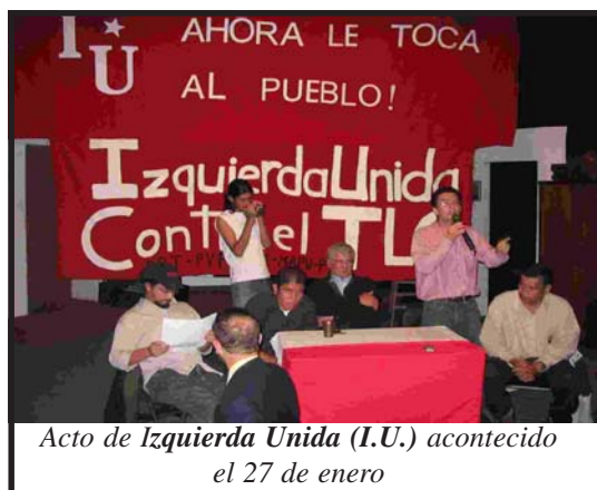
Acto de Izquierda Unida (I.U.) acontecido el 27 de enero

Mientras el gobierno descarga todo el peso de la situación económica sobre el nivel de vida de los trabajadores y demás sectores populares, los empresarios, altos funcionarios del