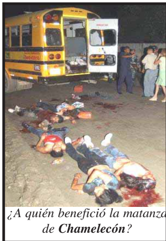
¿A quién benefició la matanza de Chamelecón?

A más de un mes de ocurrido el hecho, hay numerosas detenciones, unos pocos procesados y el supuesto ideólogo del crimen asesinado en la cárcel de Támara. Reiterativos discurso del Ministro de Seguridad acusando a los “mareros” y muchas preguntas sin respuesta. ¿Qué pasó con el alto oficial que supuestamente había vendido las armas? ¿Por qué los “mareros” que siempre se identifican con el nombre de su “barrio” ahora utilizaron el de “MPL Sinchoneros” (sic)?