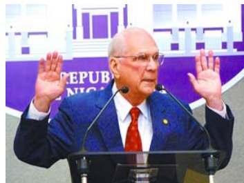
Enrique Bolaños "Acorralado".- Nicaragua