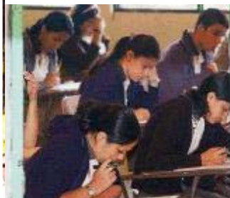
Peligra Educación Pública.- Costa Rica