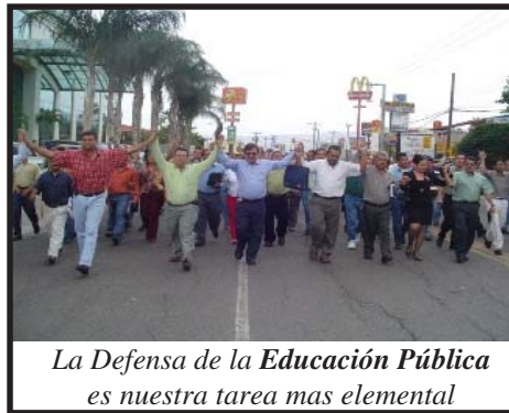
La Defensa de la Educación Pública es nuestra tarea mas elemental

Todas las Organizaciones Magisteriales realizaron su Congreso o Asamblea Ordinaria en diciembre del año recién pasado. Las expectativas de este evento anual eran que salieran directrices- resoluciones- que prepararan a los agremiados para seguir enfrentando los ataques del actual gobierno. Los resultados no fueron los esperados. En la Asamblea General realizada por el COPEMH no se aprobó ninguna resolución política