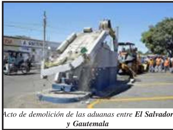
Acto de demolición de las aduanas entre El Salvador y Guatemala

reformas constitucionales, estas reformas intentan restarle poderes al ejecutivo y otorgarle a la Asamblea