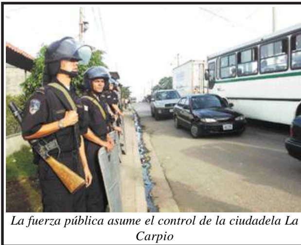
La fuerza pública asume el control de la ciudadela La Carpio

la Cruz Roja contabilizaba más de 102 civiles heridos o afectados por los gases lacrimógenos, principalmente niños, además de 8 personas con heridas de balas, 6 de ellos policías.