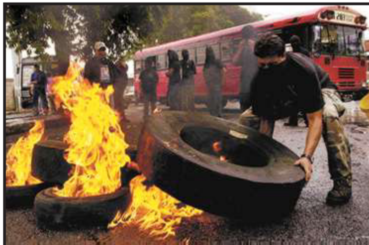
Estudiantes guatemaltecos protestan en Ciudad Guatemala