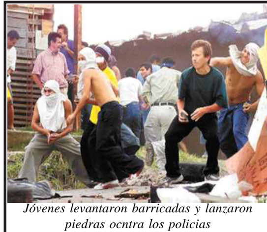
Jóvenes levantaron barricadas y lanzaron piedras contra los policías

Al paso de varios años muchas de estas promesas no fueron realizadas. Por ejemplo, la empresa EBI decidió no entregar el dinero a la comunidad, alegando malos manejos de los dineros por las disputas entre varias organizaciones comunales que buscaban concentrar los fondos. También, no se realizaron obras