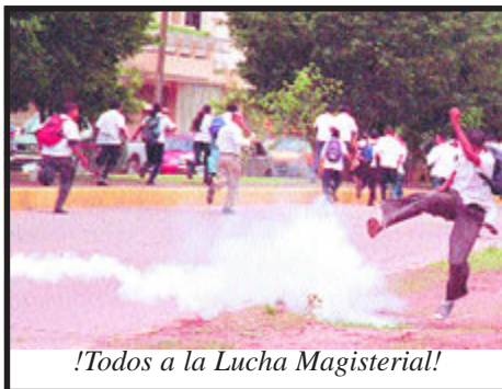
!Todos a la Lucha Magisterial!

1. Unidad interna: El magisterio ha superado la división que lo mantuvo fragmentado y debilitado los últimos dos años; esta vez estamos unidos y hasta ahora todas las organizaciones magisteriales han evidenciado tener la misma agenda de lucha. Mantener la unidad es fundamental para ganar confianza y fuerza en la movilización, la dirigencia debe tener cuidado de que sus diferencias no atenten contra la unidad que la base de primaria y de media siempre han tenido; las