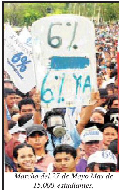
Marcha del 27 de Mayo. Mas de 15,000 estudiantes.

continuar con la consigna irrevocable de: 940 millones YA!, no se deben desmovilizar las protestas, sigamos convocando a marchas nacionales y de ser necesario a una Huelga Nacional de Universidades.