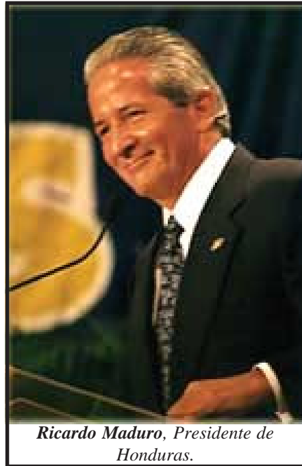
Ricardo Maduro, Presidente de Honduras.

Las próximas jornadas de luchas en Honduras son muy importantes. Desde las páginas de EL TRABAJADOR CENTROAMERICANO, sugerimos a los maestros de Honduras que den paso a un COMITÉ NACIONAL DE HUELGA conformado por delegados, democráticamente electos en las asambleas de colegios y escuelas, con el objetivo de que este organismo amplio decida las acciones a tomar en este decisivo enfrentamiento con el gobierno de Maduro. Al mismo tiempo es necesario unificar y centralizar las diferentes luchas en un solo frente contra el gobierno de Maduro.