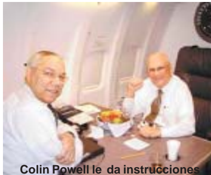
Colin Powell le da instrucciones a Enrique Bolaños

A pesar de que los diputados liberales se arrastraron ante Colin Powell, procurando obtener el perdón y excarcelamiento de su “líder”, Arnoldo Alemán, la repuesta del prócsul fue tajante: el gobierno de los