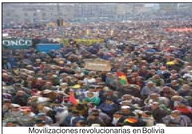
Movilizaciones revolucionarias en Bolivia

El otro tercio de la economía: sectores de la actividad agropecuaria, agua, electricidad y transportes creció por debajo del 3%, exceptuando al sector petrolero que ascendió en un 20%. Además, el déficit público es del 8%. Las recetas del FMI insisten en recortar el gasto