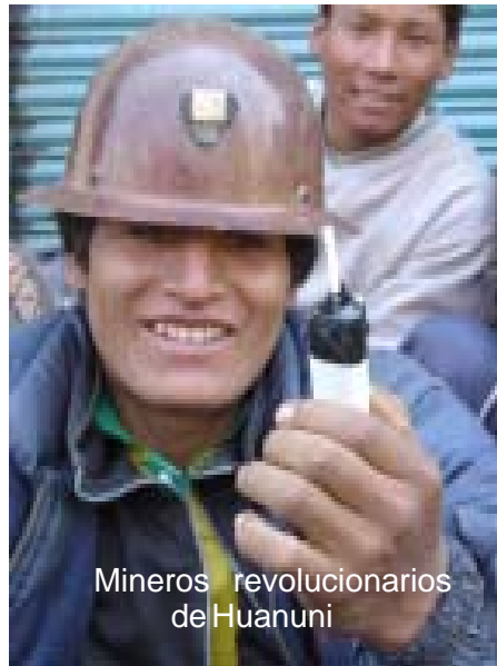
Mineros revolucionarios de Huanuni

Carlos Mesa, se mueve en ese sentido?, ha asistido a reuniones de campesinos junto con los dirigentes de los sindicatos campesinos y la COB. Este hecho, en sí mismo, es un reconocimiento tácito de la verdadera correlación de fuerzas de clase.