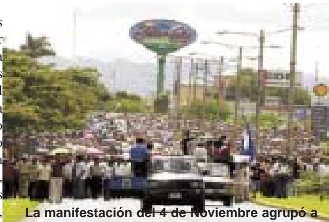
La manifestación del 4 de noviembre agrupó a más de 10,000 personas

La UNEN y el Consejo Nacional de Universidades (CNU), ante las críticas