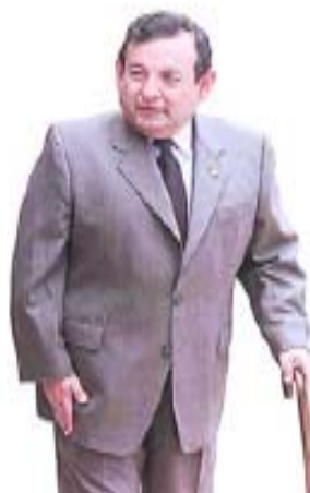
Perez Cadalso, nuevo rector impuesto

¡Por la defensa de la autonomía!; Por la democratización de la FEUH!; No a la imposición de la Ley Orgánica!; Por la defensa de la educación pública!; No a los exámenes de admisión!