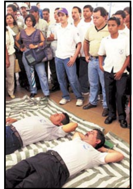
• Dirigentes magisteriales en huelga de hambre

de sus obligaciones trasladando el costo del mantenimiento de la infraestructura educativa (pupitres, aulas, gimnasios, materiales de aseo, etc.) que son costeados con dinero de los padres de familia y trabajo físico de los propios estudiantes sin retribución alguna. De igual manera, es práctica común en las escuelas y colegios que los servicios de vigilancia y aseo sean pagados por los padres. Hoy es normal que los estudiantes vendan rifas, organicen fiestas, concursos y campeonatos para conseguir fondos para alguna actividad educativa que el Estado debería garantizar.