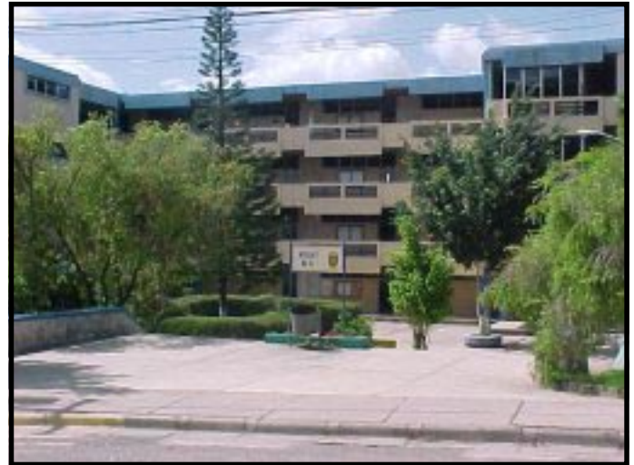
Universidad Nacional Autónoma de Honduras

Como hemos visto la "IV Reforma" es el instrumento que le permitirá al Consejo Universitario destruir una serie de conquistas del estudiantado haciendo más difícil el ingreso de los hijos de los trabajadores al Campus Universitario, convirtiendo la educación pública en actividad de unos pocos, sectorizada por los que poseen capacidad de pago. Por otro lado, lo que busca la "Cuarta" es beneficiar a un grupo de empresarios que poseen en sus manos los laboratorios, talleres y demás espacios que forman parte de la ciudad universitaria y que por supuesto, puedan vender sus servicios a los estudiantes universitarios. De