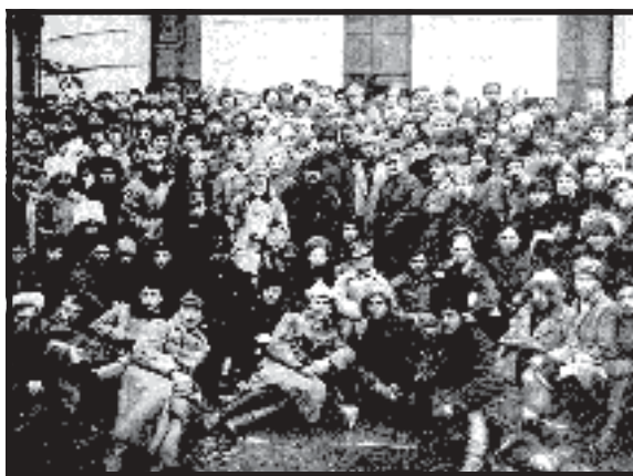
• Lenin y Trotsky confundidos con los obreros y soldados protagonistas de la toma del Palacio de Invierno centro del poder en Rusia en 1917.

tranjero, que se lanzaron a la huelga general. El zarismo retrocedió y creó una especie de Asamblea Legislativa (La Duma), controlada por la burguesía liberal. A su vez las masas populares, que nunca confiaron en la Duma, se organizaron en su propio "parlamento": en los