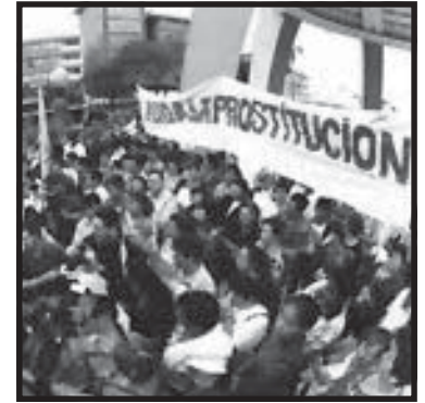
• El padre Minor encabeza la protesta contra el congreso de prostitutas.

El padre Minor lo único que defiende es la doble moral, la hipocresía propia de la sociedad burguesa, que mientras pregona los principios morales cristianos, quiere mantener en la