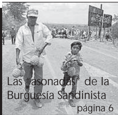
Las "asonadas" de la Burguesía Sandinista página 6

Honduras: L. 3.00 - Nicaragua: c$ 5.00 - Costa Rica: ₡ 100.00