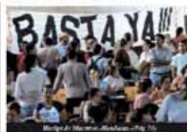
Reunión de Mujeres-Modesto (Pag. 10)

GUATEMALA ¿Por un Gobierno de los Trabajadores, Obreros, Comerciantes e Independientes? Evaluación de la PSC y reorganización por parte de las estructuras y Organizaciones Popula- res. ¿Por a los planes del imperialismo y la burguesía? Unidad que la Democracia del Movimiento. Estados Unidos Los Atrochos de Leona Ceballos de Marzo y Año de 1900 EL SALVADOR ¿Por que fue derrotado la Huelga del SETRES?