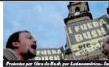
Protestas por Giro de Bush por Latinoamérica-Te

Ante el conflicto Fronteri Obtuso de los gobiern