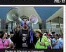
Desfile de Mujeres en Guatemala

Nicaragua Evaluación de la situación y Estrategia socialista. Que Oligo monopolice el servicio de energía eléctrica. Punto y Caguatón FULM PLC COSTA RICA La Trampa del Behetrismo EL SALVADOR El Anuncio del Asesinato del General Enri- que Zapata. INTERNACIONAL Fuerza de Mujeres y Asesinato de Carlos Faria Roldán