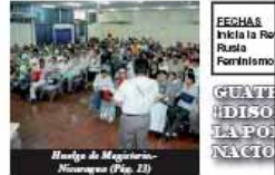
Huelga de Magisterio- Nicaragua (Pag. 22)

ESHA NCHA IN Rusia Fortísimo GUATEMALA ¡¡APO NACIO