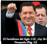
El Socialismo del Siglo XXI: Soy Sol. Ynezuela (Pag. 22)

GUATEMALA ¡¡DEMANDAMOS CANDIDATURAS DE LÍDERES POPULARES ELEC- TOS DEMOCRÁTICAMENTE!! LA SUPERINTENDENCIA DE BANCOS Y LA JUNTA MON- ETARIA SON CÓMPlices DE LA QUEBRADA DEL BANCO DE COM- ERCIO REPUDIEMOS LA PRESENCIA MILITAR ESTADOUNIDENSE EN GUATEMALA