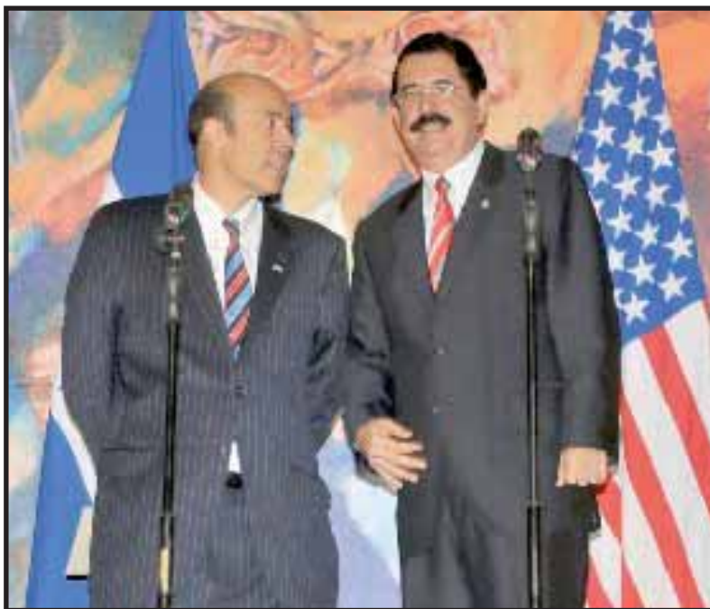
Hugo Llorens, nuevo embajador de EE.UU. y “Mel” Zelaya

El retardo del gobierno de Mel Zelaya en recibir las credenciales del nuevo embajador de EE.UU., Hugo Llorens, causó revuelo no solo a nivel local sino internacional. Aparentemente es una faceta más del “comandante vaquero”, quien sigue jugando a ser adversario de los gringos y ganándose el abrazo del movimiento popular, pero rechazado por del resto del pueblo no organizado que está harto de este circo en el que ya no se sabe quién es quién.