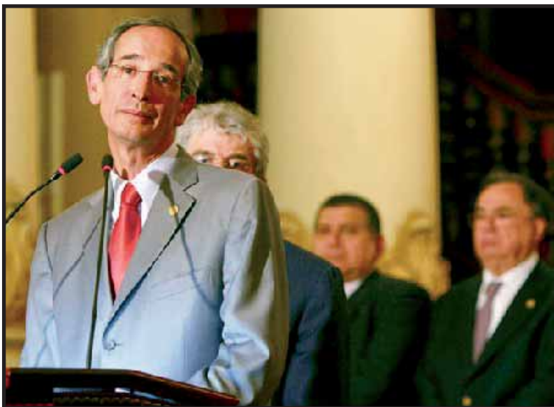
Alvaro Cólom denuncia el espionaje, y anuncia la renuncia de Carlos Quintanilla

el gobierno de Guatemala, donde se espía al presidente desde su propio despacho". Curiosamente, ninguno de los numerosos y serios analistas guatemaltecos que escribieron sobre el episodio de espionaje al gobierno consideró que el gobierno de los USA estuviera detrás del asunto. Ni el propio Cólom lo creyó así, tanto que el mandatario afirmó el 12 que solicitaría información a la embajada venezolana sobre las declaraciones de Chávez, pero nunca más ha vuelto a mencionar el tema.