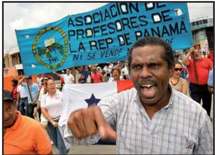
El Segundo Paro Nacional de Advertencia estuvo débil

por el Respeto a la Vida y la Dignidad del pueblo, así como FRENASESO, deben sacar un balance sobre la debilidad del paro nacional del 4 de septiembre.