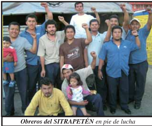
Obremos del SITRAPETÉN en pie de lucha

El día miércoles 10 de septiembre del año en curso tuvimos una reunión con el ministro de trabajo y nos pudimos dar cuenta de la complicidad que tiene con esta familia de explotadores, ya que incluso formuló