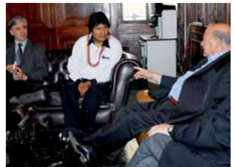
Evo Morales con Miguel Insulsa (OEA).- Internacional Pág.-12