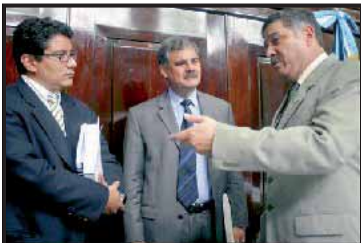
El Ministro y el Viceministro de Finanzas conversan con un diputado de la Comisión de Finanzas

como siempre, a m e n a z a n con el cierre de empresas. Según el presidente de la Cámara de Industria de Guatemala, Thomas Dougherty, "el peor desorden social lo provoca el desempleo, en el que se cae al gravar el capital de las empresas" (Prensa Libre,