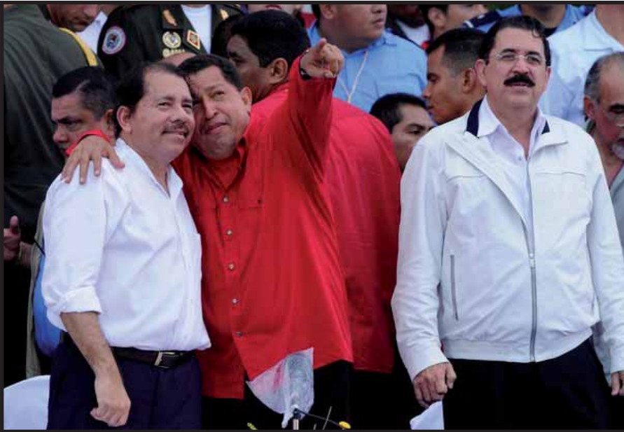
¿Abandonará "Mel" a sus nuevos amigos?

Después del triste show del "comandante vaquero", esta realidad marcada con sangre y amenazas debemos enfrentarla unidos como un solo puño. Esta falsa línea populista del gobierno de Mel Zelaya debe ser