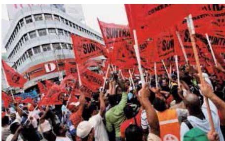
Balance del Segundo Paro Nacional.- Panamá (Pág.-09)