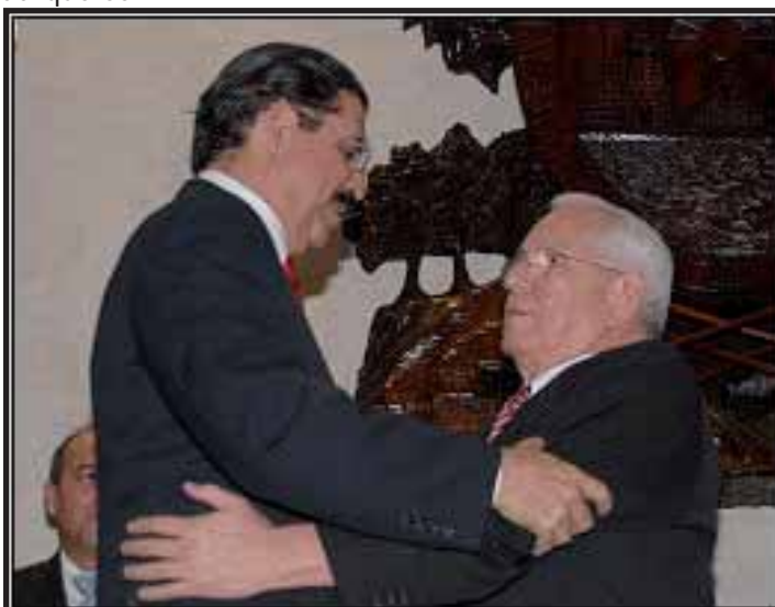
"Mel" Zelaya y Roberto Micheletti se pusieron de acuerdo en impulsar la ratificación del ALBA.

político, que se abrió el tema sobre la incorporación de Honduras al ALBA, el Presidente del Congreso Nacional, Roberto Micheletti Bain, ha sido categórico al manifestar su rechazo "que si de él depende la aprobación no lo hará." (El Heraldo 23/8/08).