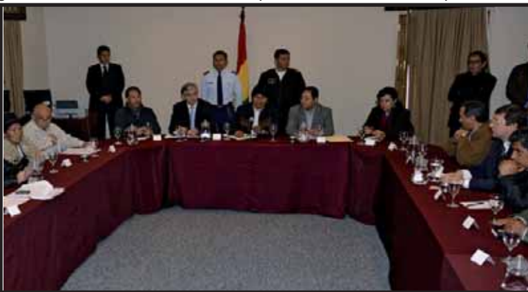
Evo Morales negocia con los que ayer llamaba "fascistas"

El Gobierno del MAS se aprovechó de que las masas aún poseen aspiraciones y confianza en el Gobierno, para contener a la