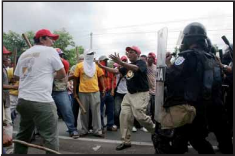
Las "turbas" no sólo reprimieron la manifestación opositora, sino que también se enfrentaron a la Policía.

El ataque de fuerzas de choque del FSLN contra la marcha en la ciudad de León, el pasado 20 de septiembre, organizada por la Coordinadora Civil, es el punto más álgido de esta lucha política entre facciones sandinistas, pero trasciende mas allá por que encierra un violento ataque del FSLN a las libertades políticas de reunión