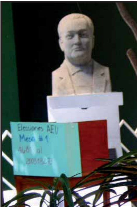
Urna semi-oculta durante las elecciones estudiantiles

POR EL RESCATE DE LAS ORGANIZACIONES POPULARES DE LUCHA ESTUDIANTIL Y SOCIAL, POR EL RESCATE DE LA AUTÉNTICA AUTONOMÍA UNIVERSITARIA, NO A LAS POLÍTICAS REPRESIVAS Y NEOLIBERALES, NO LA PRIVATIZACIÓN, FUERA LOS OREJAS (MILITARES INFILTRADOS DENTRO DE LA USAC). PROLETARIOS DE TODOS LOS PAÍSES UNÍOS ■