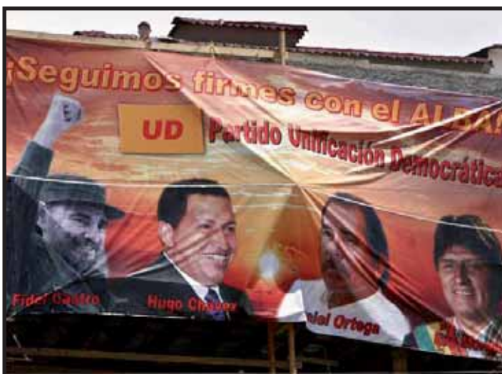
La izquierda y la CNRP deben exigir la convocatoria de un Referendo para ratificar el ALBA

El Movimiento al Socialismo (MAS) de Honduras hace un llamado a todas las organizaciones populares que pertenecen a la CNRP, para organizar de manera conjunta un amplio debate en todos los sectores de influencia de nuestras organizaciones y romper políticamente con el gobierno de Mel Zelaya, no hacer colaboracionismo de clase y emplazarlo para el conocimiento público del documento del ALBA, así como luchar conjuntamente por la realización de un referéndum para la ratificación o aprobación y la definición del mecanismo de la utilización de los fondos de dicho convenio. ■