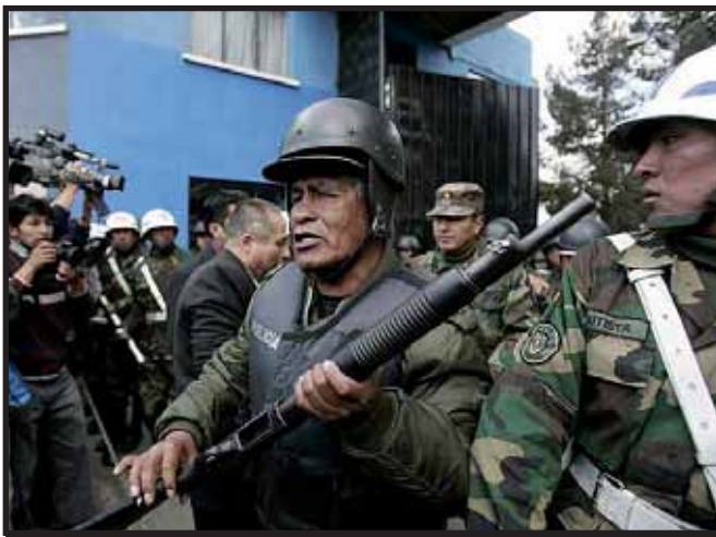
En vez de apoyarse en la movilización de masas, Evo Morales se apoyó en el Ejército y la Policía

Desde el viernes 12, y ante la profundidad de la crisis, los opositores y el Gobierno a través del Vice-Presidente Álvaro García Linera decidieron retomar el diálogo. Mario Cossio, gobernador de Tarija, fue designado para representar a los gobernantes opositores, y declaró: "Hemos coincidido en la necesidad de la pacificación del país y en poder fin a la violencia. Sobre estas ideas hemos determinado un cuarto intermedio para consultar a las regiones. El Gobierno