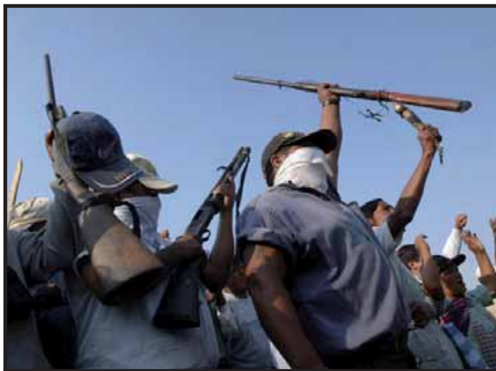
Opositores al Gobierno de Evo Morales en el Departamento de Santa Cruz

Pero Morales, aún y con su triunfo, no tiene el control institucional suficiente para imponer su texto Constitucional, pues el 1 de Septiembre la Corte Nacional Electoral de Bolivia (CNE) frenó la convocatoria al "Referendo Aprobatorio" aduciendo que tal convocatoria debe hacerse