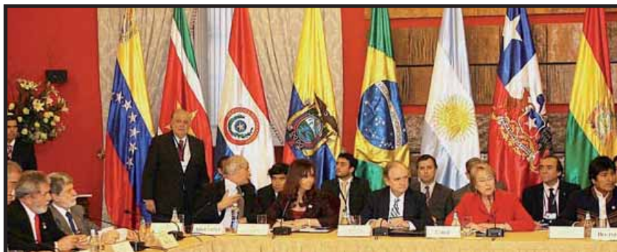
Ante el ataque de la derecha, Evo Morales se refugió en UNASUR

Estos ingresos son la "manzana de la discordia" pues "El gobierno boliviano se queda ahora con alrededor de 85% de esas ganancias, y las exportaciones, combinadas con los crecientes precios globales de los