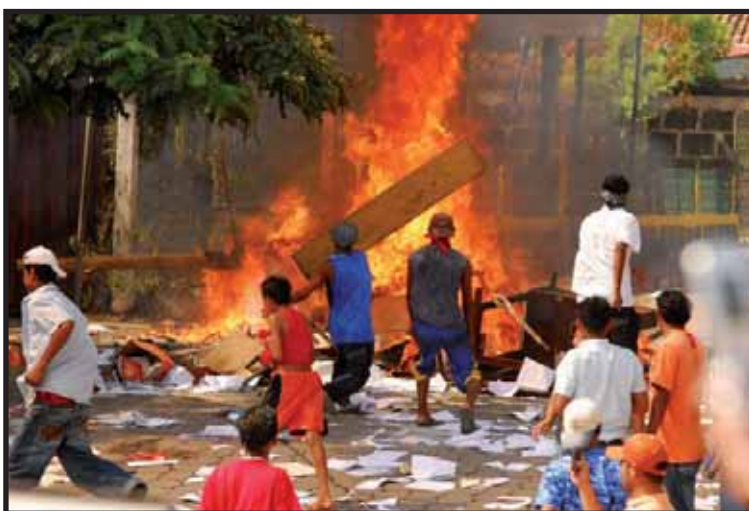
La población de La Paz Centro prácticamente se insurreccionó contra la Policía Nacional

Es necesario que la Policía profesionalice a sus oficiales, y que estos sean seleccionados mediante normas de comportamiento y pruebas