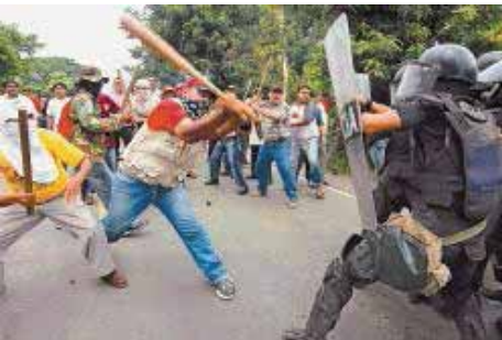
Defendamos las libertades democráticas.- Nicaragua (Pág 2 y 3)