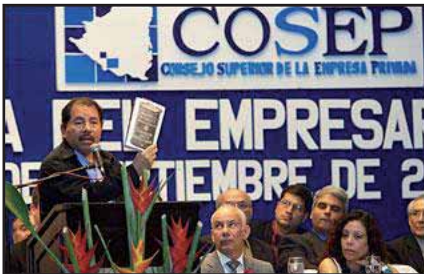
Daniel Ortega con la plana mayor de la burguesía nicaragüense