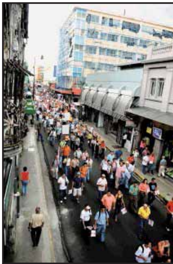
Marcha de APSE en San José

Una parte del magisterio ha salido beneficiada en la negociación, pero el tema del rezago del 6,42% para los bachilleres continúa pendiente. Los maestros no deben permitir que los sectores con menos calificación técnica, aunque tal vez con más experiencia, queden a la deriva. No se debe abandonar la lucha de los bachilleres, no se debe permitir que debiliten y dividan al gremio.