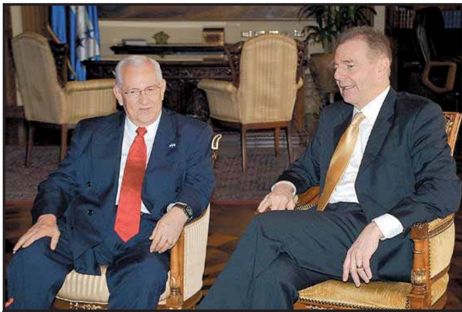
Roberto Micheletti discute su retiro con Craig Kelly, Sub-Secretario de Estados de EE.UU. para asuntos latinoamericanos

“Exponer a los oprimidos la verdad sobre la situación es abrirles el Camino de la revolución.” Trotsky