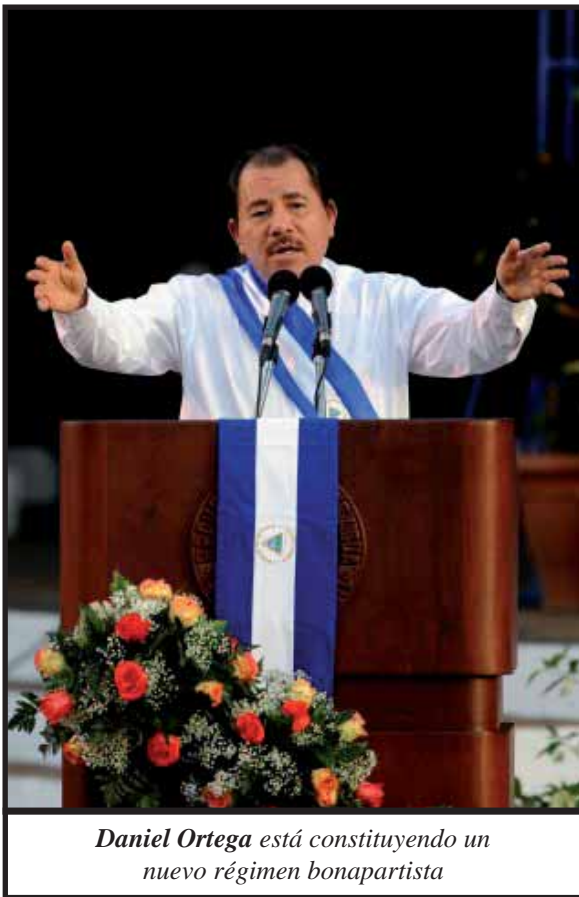
Daniel Ortega está constituyendo un nuevo régimen bonapartista