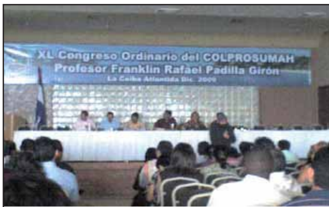
XL Congreso Ordinario del COLPROSUMAH