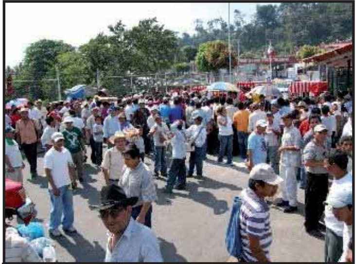
Campeños protestan contra cortes de energía

Para poner en aun más en evidencia la naturaleza del sistema y el servilismo del gobierno, el día 20 de enero el gobierno inauguró una base militar al mando del Departamento Antidrogas de los Estados Unidos (DEA) en el departamento costero de Escuintla, dicha base queda ubicada en el kilómetro 102 de la carretera a Puerto Quetzal.