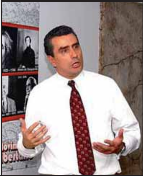
Otto Guevara del Movimiento Libertario (ML)

votar por Ottón Solís, manteniendo sus propias candidaturas a diputados y regidores, eso sí, con la intención de que en el eventual caso de que Solís resultara triunfador, su gobierno sería de "Unidad Nacional". En cuanto a este llamado al