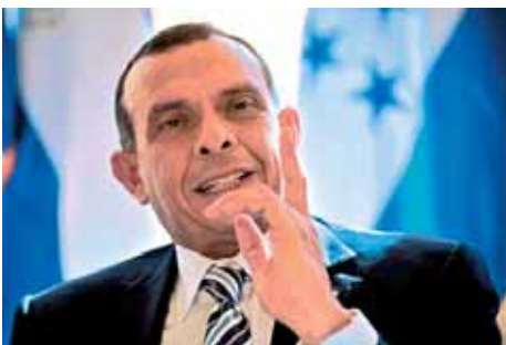
Los golpistas se retiran victoriosos.- Honduras.- Pág.-04