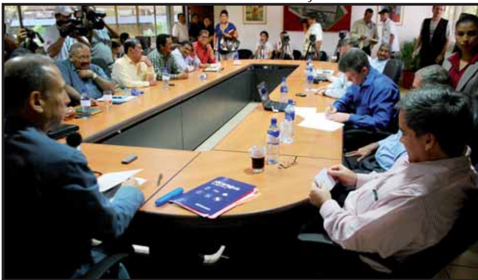
Mesa tripartita de Negociación del Salario Mínimo

de Trabajadores (CST), solicito que el aumento fuese de un 18% y un 20% para el campo, lo cual al Consejo Superior de la Empresa Privada (COSEP) quienes en un principio proponían un 9%, no le a parecido y le ha venido dando largas a las reuniones, para de esta forma desgastar a los trabajadores y que tarde o temprano terminen aceptando las raquíticas propuesta que proponen estos empresarios.