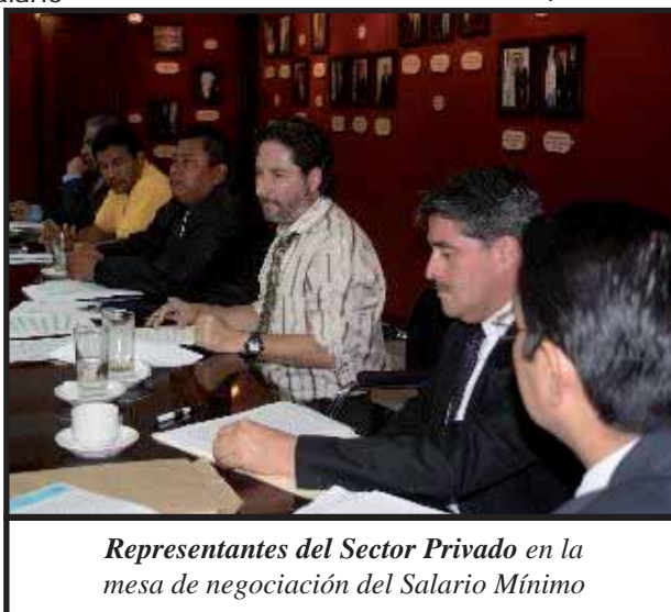
Representantes del Sector Privado en la mesa de negociación del Salario Mínimo

Si bien es cierto que fue el presidente Álvaro Colom quien decidió este ridículo aumento, estos son cambios que naturalmente se deben realizar en estos sistemas, pues al aumentar la inflación aumentan los precios y el poder adquisitivo de las masas tiende a disminuir dejando de circular el dinero que tanto se pelean los empresarios, dejando de funcionar el sistema capitalista (estas son las llamadas recesiones). El gobierno hace gran alarde de esta limosna y de sus ayudas