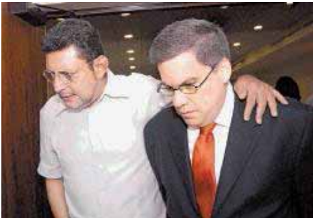
El FSLN negocia la Reforma Tributaria con la Burguesía- Nicaragua.- Pág.-20

¡¡ ABSTENCIÓN ELECTORAL EN LAS ELECCIONES DEL 7 DE FEBRERO!!