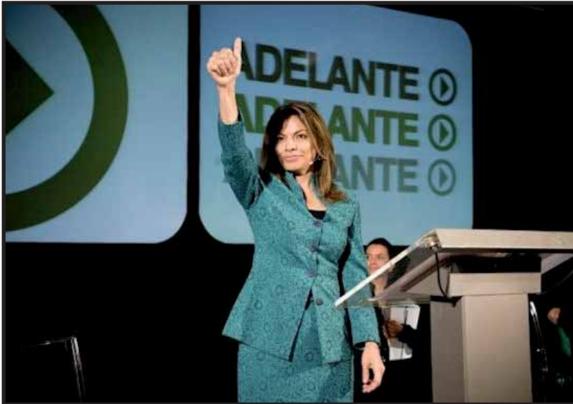
Laura Chinchilla Miranda, candidata del Partido Liberación Nacional (PLN)

La historia reciente de Costa Rica está marcada por las gigantescas movilizaciones de la lucha contra el Combo en el año 2000, luchas de maestros y empleados públicos, radicalización de sectores juveniles, y enormes manifestaciones contra la aprobación del CAFTA; pero también por procesos electorales en los que la lucha de las masas trabajadoras termina disipándose en el boleta electoral. No se puede comprender la actual coyuntura electoral, sin analizar lo que ha ocurrido en el último periodo.