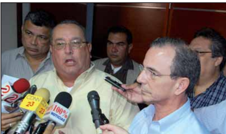
Arnoldo Alemán y Eduardo Montealegre, anunciando la “Unidad Liberal”

Al presentar el proyecto de ley, no cumplieron con las formalidades y el tremendo cañonazo terminó nuevamente en la nada.