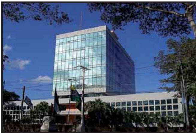
El incremento del aporte patronal refleja la crisis financiera del Instituto Nicaragüense de Seguridad Social

El fraude electoral y la crisis financiera no deben ser pagadas por los trabajadores y asalariados, sino por la burguesía, debemos exigir una reforma tributaria real: que grave a la gran burguesía, y no los trabajadores. ■