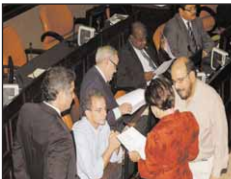
NICARAGUA.- Suspiros de la oposición por el Diálogo Nacional

PANAMÁ: Oleada de luchas obreras por aumento de salarios.