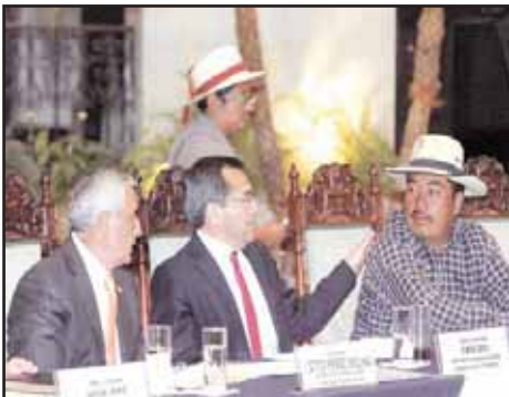
GUATEMALA.-El gobierno prepara la sogá contra los trabajadores.

“Por la Reunificación Socialista de la Patria Centroamericana”