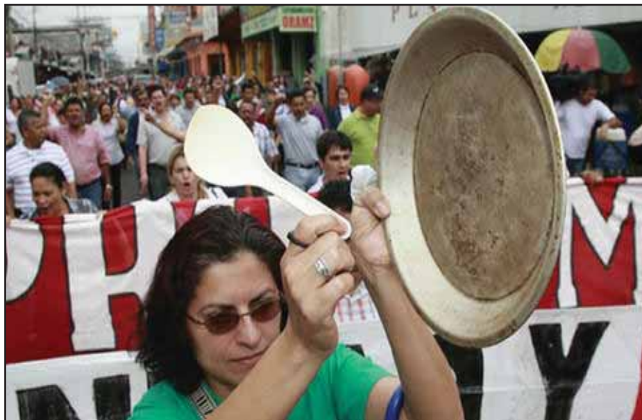
Maestros protestando contra la carestía de la vida y los bajos salarios