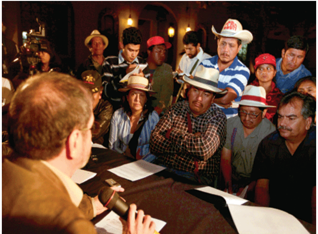
Líderes campesinos escuchan las propuestas del gobierno

que lleva por nombre "Ley del Salario Mínimo Diferenciado", no generaría aumentos en los salarios, sino que busca una estructura de salarios "en la que se puedan establecer salarios mínimos diferenciados, donde la diferenciación consiste en que el sector económico fije un salario mínimo, ya que existen