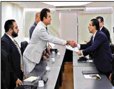
HONDURAS.- Circo electoral en un país en crisis.

PANAMÁ: Oleada de luchas obreras por aumento de salarios.