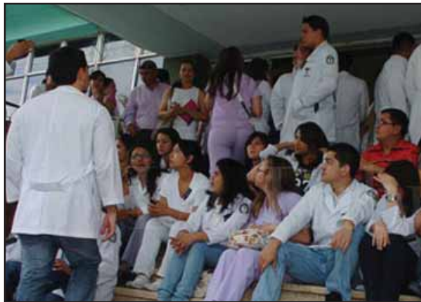
Médicos en huelga

La gran crisis económica ocasionada con el Golpe de Estado ha traído funestas consecuencias para la clase media asalariada y los microempresarios, quienes han sufrido permanentemente con los altos costos de los diversos productos que tienen que ver con el consumo de combustible y de energía eléctrica. Con el latrocinio a que