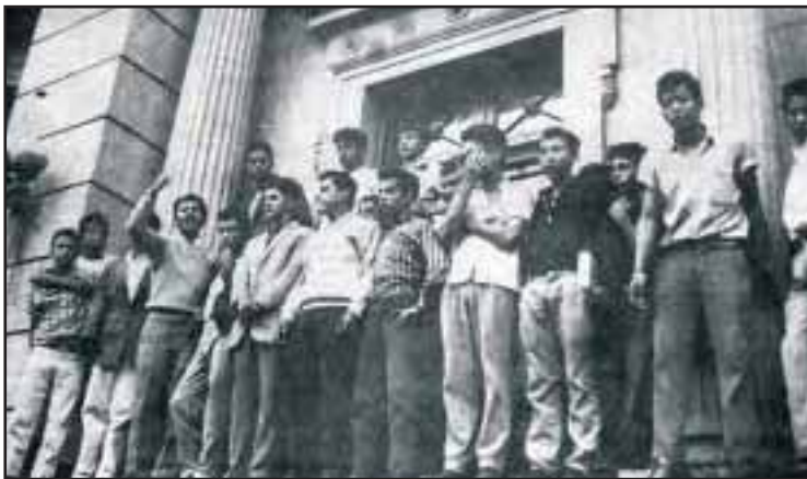
Luchas de marzo y abril 1962

desestabilización dentro del mismo régimen fueron los distintos levantamientos militares que se dieron desde el mismo momento de la contrarrevolución, muchos de ellos protagonizados por militares imbuidos de un espíritu nacionalista heredado de la revolución y que se cristalizaron en el intento de golpe de estado de 1960 dirigido por oficiales medios con Turcos Lima y Yon Sosa a la cabeza. Esto tuvo como causa el hecho que el gobierno cedió unas fincas en la costa suroccidental para que se preparara y entrenara la derrotada invasión a Cuba en 1961.