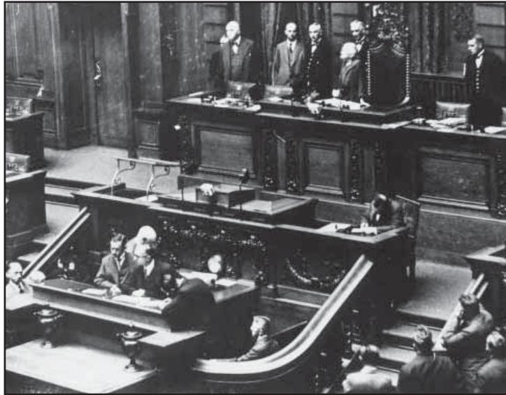
Clara Zetkin presidiendo el Reichstag en 1932

Ella escribiría: "Lo que merece una atención particular es el hecho de que en los países del Próximo y Extremo Oriente, las mujeres vinculadas a las tradiciones,