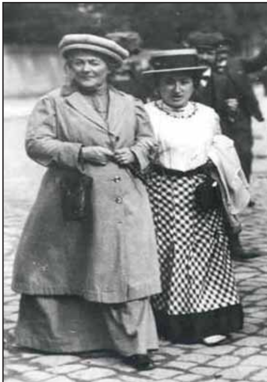
Clara Zetkin y Rosa Luxemburgo

primeras posiciones teóricas serias en el tema en su muy conocido libro El Origen de la Familia la Propiedad Privada y el Estado. Engels analizaba y equiparaba la dominación de clase con la dominación de la mujer por el hombre. Sin embargo, la liberación de la mujer sólo se puede lograr tras una revolución socialista que destruya el capitalismo. Esto implicaba que la lucha de las mujeres estaba unida intrínsecamente a la del movimiento obrero por su emancipación, es decir la lucha por librarse de la clase explotadora