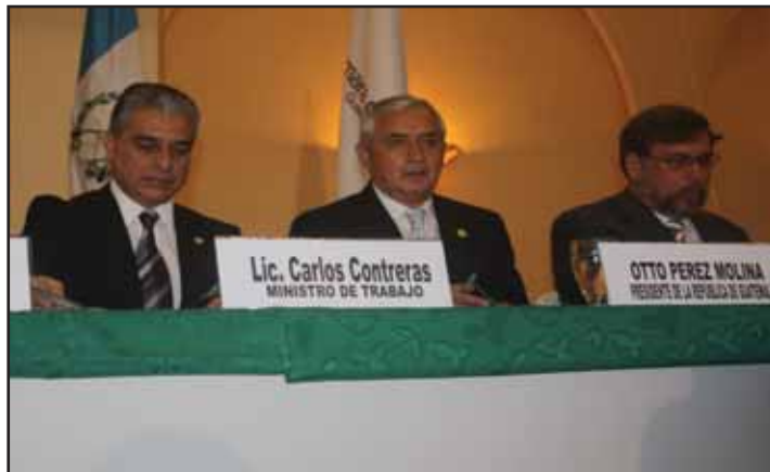
El gobierno y la Cámara del Agro firman política laboral