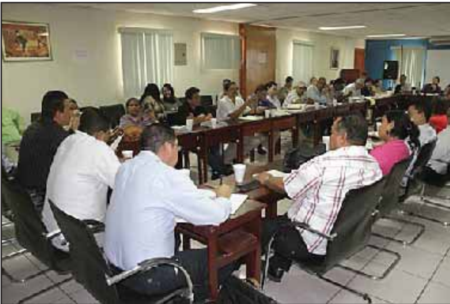
Las negociaciones se alargan por la división sindical

Estas posiciones son una clara claudicación del Gobierno de Daniel Ortega y los empresarios, quienes a cambio de mantener la explotación laboral sobre los trabajadores le han venido dando su apoyo y visto bueno en la implementación de sus políticas capitalistas.