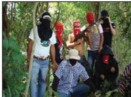
EL SALVADOR.- ¿Resurgimiento de nuevos grupos guerrilleros?