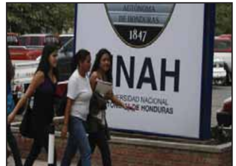
HONDURAS.- Pongamos atención a elecciones estudiantiles en la UNAH