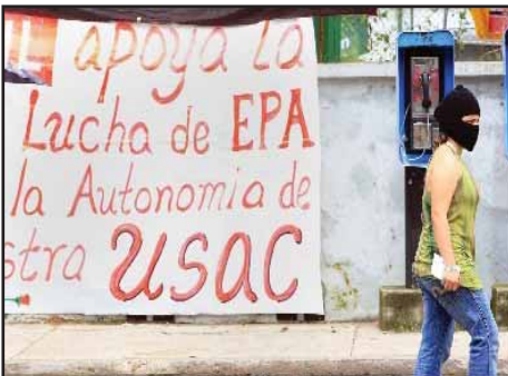
GUATEMALA.- Continúa la lucha por la defensa de la autonomía en la USAC