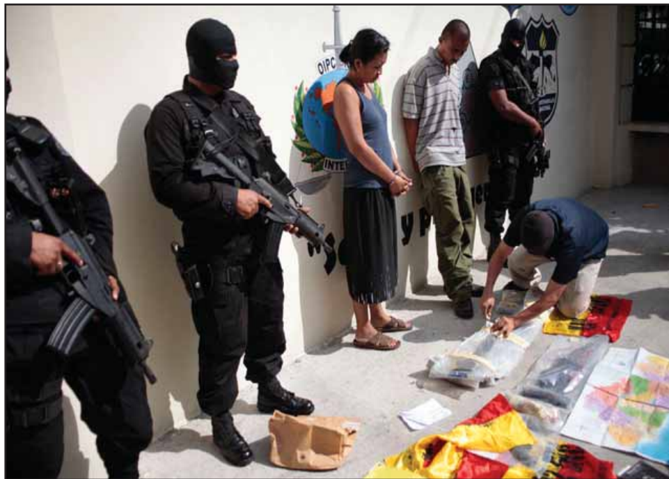
Supuestos "guerrilleros" capturados con propaganda política

Todavía no queda claro si estamos ante una maquinación de los órganos de seguridad, para justificar el proceso de remilitarización que sufre la sociedad salvadoreña, o si estamos ante una gigantesca provocación policial en el