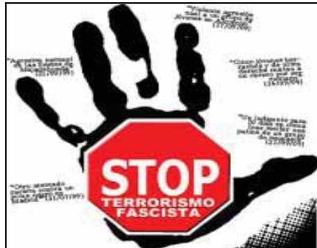
EUROPA: La ultraderecha y el fascismo toman fuerza