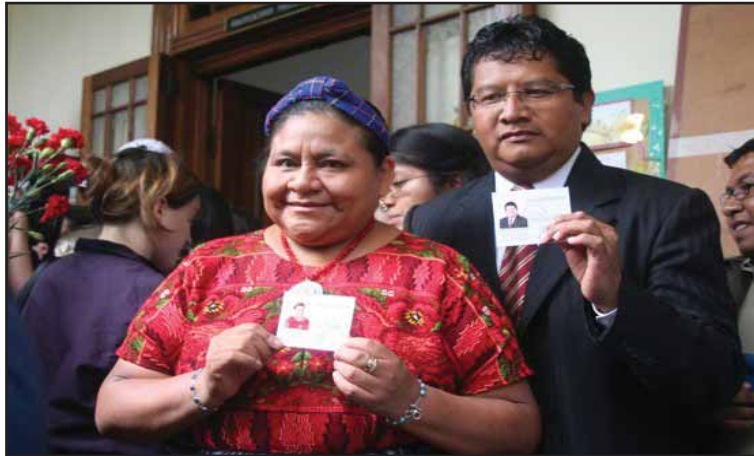
La candidatura presidencial del Frente Amplio

Las siguientes citas tomadas de la versión del programa colocada en la red nos muestran