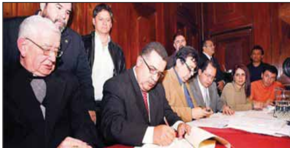
Firma de los Acuerdos entre el CSU y EPA

El objetivo de tal reforma a la ley orgánica es regular el funcionamiento de