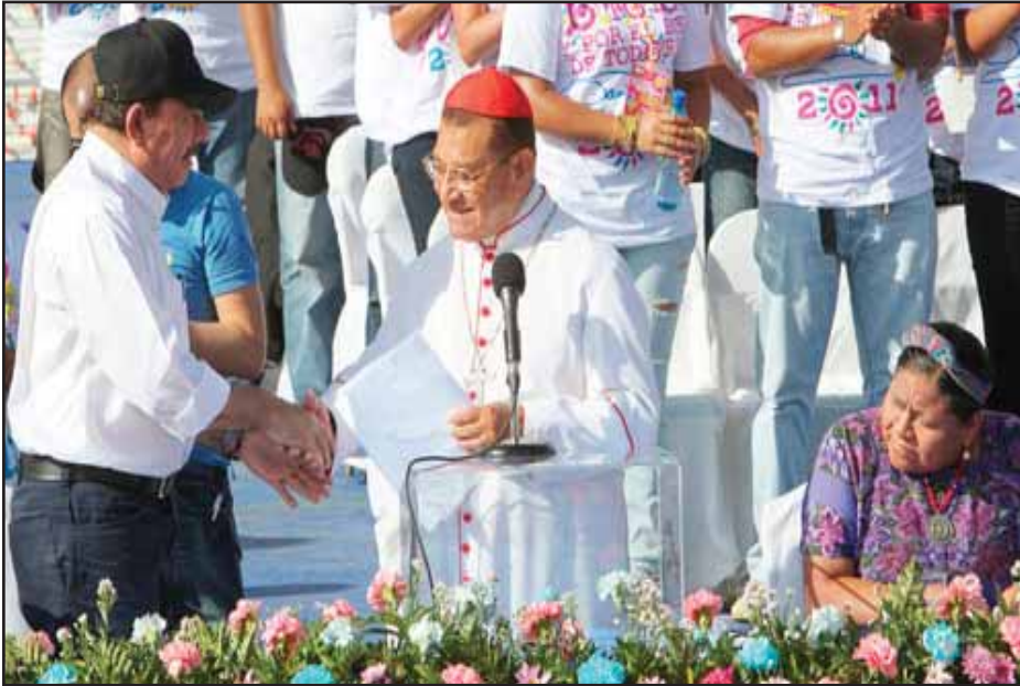
Daniel Ortega y el Cardenal Miguel Obando en el pasado acto de celebración del 19 de Julio