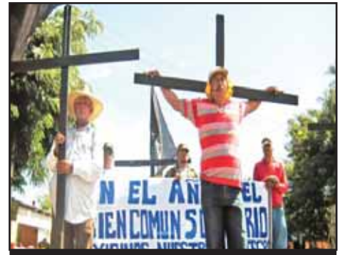
NICARAGUA.- Los trabajadores defienden sus derechos