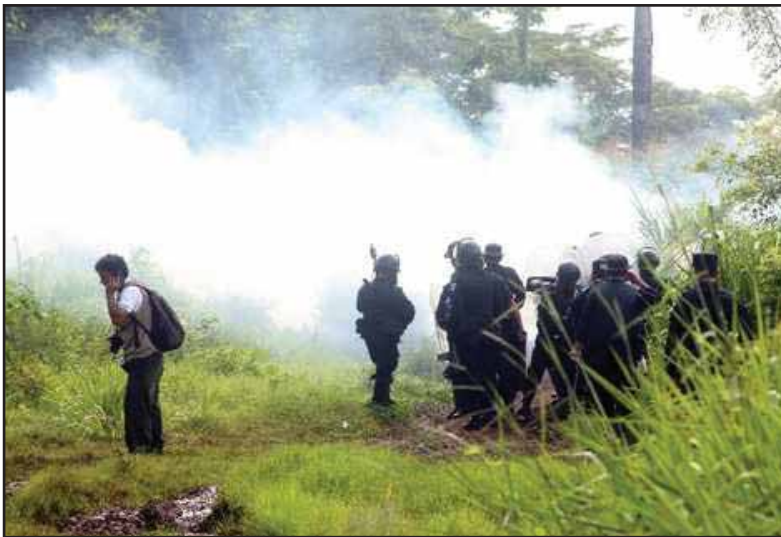
Desalojo en Cafetales de Santa Cruz Muluá

Por otro lado, la legislación penal no debería ser usada, para ventilar estos conflictos agrarios que responden, a otras razones, que no son de índole penal. Qué bien debería buscarse otras formas de resolver estos problemas.