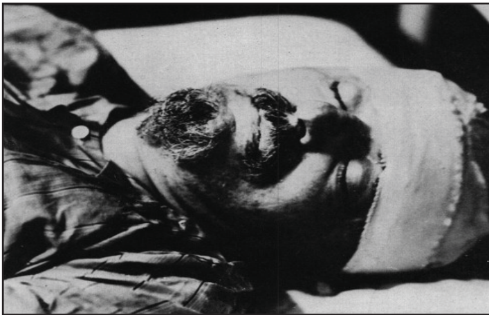
El cadáver de León Trotsky

del 23 al 24 de mayo. Al fallar el atentado, decidieron utilizar a Jacson Monard, ya infiltrado en el círculo de Trotsky. Este había luchado en la guerra civil española para luego ser entrenado por la GPU en Moscú. Su verdadero nombre era el de Ramón Mercader, hijo de Caridad