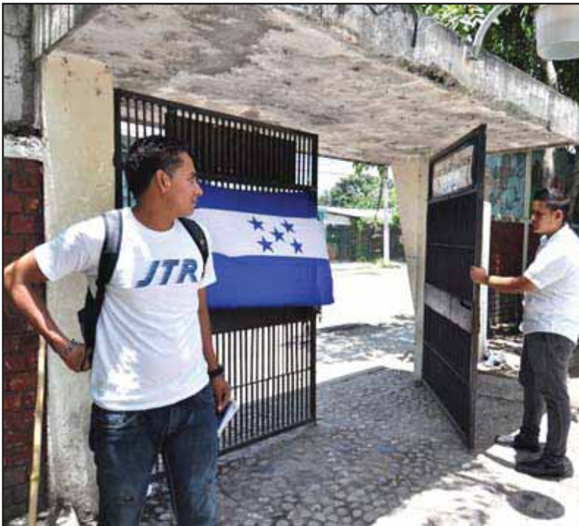
Los colegios e institutos son tomados por los estudiantes

Una de las principales tareas del Comité debe ser la de estructurar una jornada de lucha nacional para la defensa de la educación pública y frenar la embestida del gobierno de Lobo Sosa, así mismo incentivar la organización nacional y la participación de todo el movimiento estudiantil en su conjunto. Este comité debe planificar la lucha a través de asambleas estudiantiles donde prevalezcan los mecanismos democráticos y la independencia política. ■