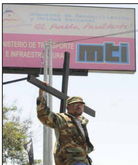
Sindicalistas se crucifican demandando el reintegro

de la Confederación de Unidad Sindical (CUS), “Este es un caso de violación sindical terrible. Estos trabajadores han recurrido a todo lo humanamente posible, huelgas de hambre, protestas pacíficas, tribunales de justicia y nada. Aquí se están violentando los convenios 98 y 87 suscritos ante la OIT, por eso tenemos abierta una querrela ante esta institución internacional” . (El Nuevo Diario, 27 de Julio del año 2007).