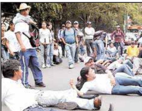
GUATEMALA: Los empleados públicos se enfrentan al gobierno

EL SALVADOR !!CONTINÚA LA LUCHA POR EL AUMENTO SALARIAL, LA DEFENSA DE LA EDUCACIÓN Y LA SALUD!!