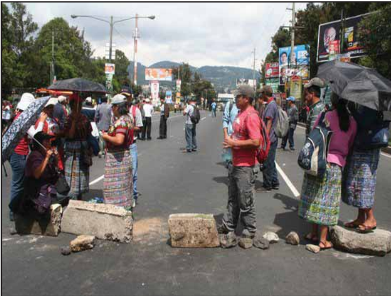
Maestros bloquean carreteras

todo lo que se han propuesto al librar sus batallas. Los maestros y los trabajadores de la salud tienen el mismo patrono: el Estado burgués que está siendo debilitado por las políticas neoliberales impuestas por el imperialismo y por el gran capital guatemalteco. Por eso, unidos podrán golpear con más fuerza al enemigo común. Esta unidad en la lucha será a favor del pueblo, que al final es el que sufre con la reducción de estos servicios y de ser victoriosa su lucha el pueblo será el beneficiado y de allí saldrán los frutos del cambio que hoy por hoy se trata de conseguir librando esta batalla. ■