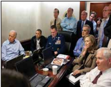
PAQUISTAN.- Estados Unidos ejecutó a Osama Bin Laden