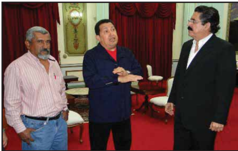
Chavez impulsa la reconciliación del FNRP con Pepe Lobo

Esta tan adelante el proceso de negociación que la OEA abordó el día viernes 13 de Mayo la situación de Honduras tras la anulación de los juicios de Zelaya. “Los miembros del Consejo Permanente del organismo fueron convocados en las últimas horas a una “sesión privada” para tratar el tema de Honduras y su reinserción a la OEA”. Y es que la suspensión de los procesos judiciales a Zelaya ha allanado el camino para que el país normalice su situación ante la comunidad internacional. El secretario general de la OEA, José Miguel Insulza, ha afirmado que la anulación de los procesos ha puesto fin a la situación jurídica de Zelaya. “De conformidad con el artículo 39 del Reglamento del Consejo Permanente, la Presidencia ha convocado a una sesión privada para las 2:30 pm del viernes 13 de mayo de 2011, en el Salón José Gustavo Guerrero. El tema a tratar en dicha sesión privada será Honduras”, dice la comunicación girada por la OEA.