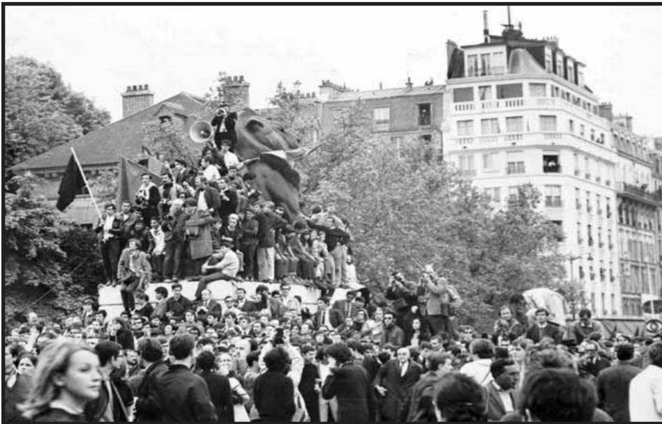
Movilizaciones estudiantiles, Mayo de 1968, Francia

jóvenes: “El fenómeno de insubordinación fue directamente influenciado por procesos de lucha antiimperialistas como Vietnam, por revoluciones socialistas, como en Cuba, que dieron nacimiento a Estados Obreros originalmente deformados; por la revolución cultural china y el asesinato del Che en Bolivia; por procesos de cuestionamiento al estalinismo en los países del Este (...) La influencia era política e ideológica. Esto se concretaba en la solidaridad activa de miles de estudiantes en Alemania, España y posteriormente en Francia hacia la lucha en Vietnam.” (Idem)