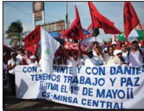
NICARAGUA.- ¿Por que ya no se celebra el 1 de Mayo?