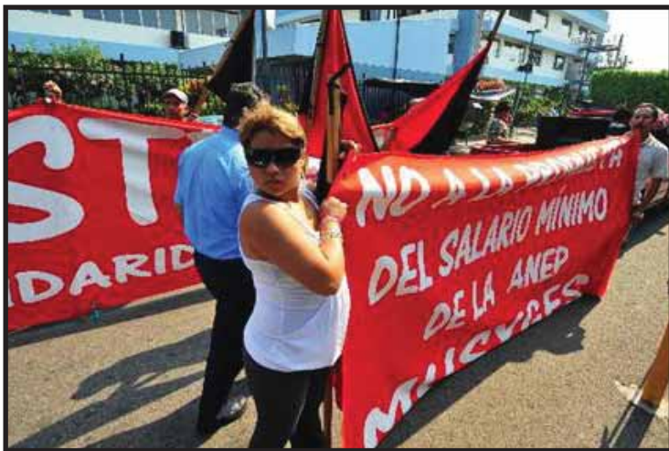
Sindicalistas protestan contra el 8% de aumento salarial

Documentos gubernamentales definen salario como la retribución que el patrono está obligado a pagar al trabajador por los servicios que le presta en virtud de un contrato de trabajo y definen salario mínimo como la retribución mínima de los trabajadores fijada periódicamente y que cubra suficientemente las necesidades de su hogar en el orden material, moral y cultural (Boletín estadístico anual 2009. Ministerio de Trabajo y de Previsión