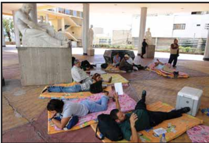
HONDURAS.- Maestros suspendidos en Huelga de Hambre

"Por la Reunificación Socialista de la Patria Centroamericana"