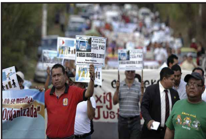
EL SALVADOR: Continúa el malestar por los bajos salarios

LAS IMPLICACIONES DE LA "ANULACIÓN" DE LOS JUICIOS CONTRA MEL ZELAYA