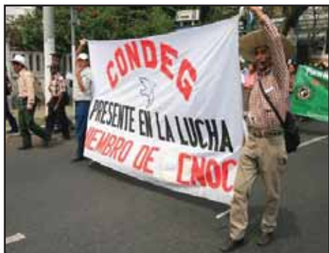
GUATEMALA.- Marchas campesinas