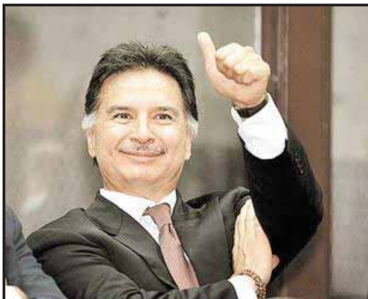
Alfonso Portillo: feliz por su absolución

Creemos que si bien hay que fortalecer el estado de derecho burgués, para utilizar las libertades que confiere, no le apostamos sólo a eso, sino a un estado socialista; pero sin embargo, para esta primera tarea reformista habrá que romper la estructura del modelo oligárquico y no caer en tacticismo de creer ingenuamente que se pueden hacer cambios desde la superestructura sin romper la estructura oligárquica. ■