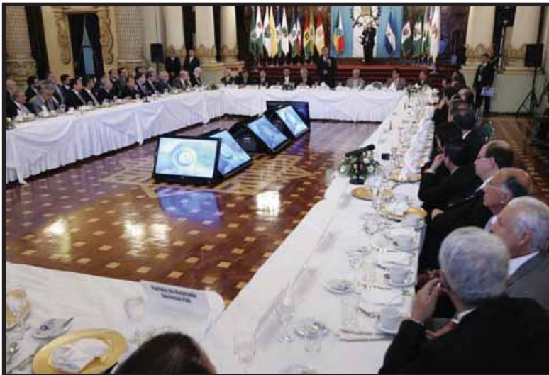
Colom trata de convencer a los políticos para que aprueben la reforma fiscal

Los trabajadores y oprimidos debemos continuar presionando al gobierno por mayor presupuesto para la salud, educación y servicios básicos. Los trabajadores estatales deben luchar por aumentos salariales. Debemos rechazar la actitud de dirigentes sindicales afines al gobierno, como los del magisterio, la UASP, la CONIC y la UGT, que se prestan para ser instrumentos del gobierno para presionar al Congreso para que apruebe sus solicitudes. El gobierno de la UNE y Colom es también un gobierno de la burguesía y es nuestro enemigo. Los trabajadores deben confiar en sus propias fuerzas y no confiar en el gobierno demagógico. ■