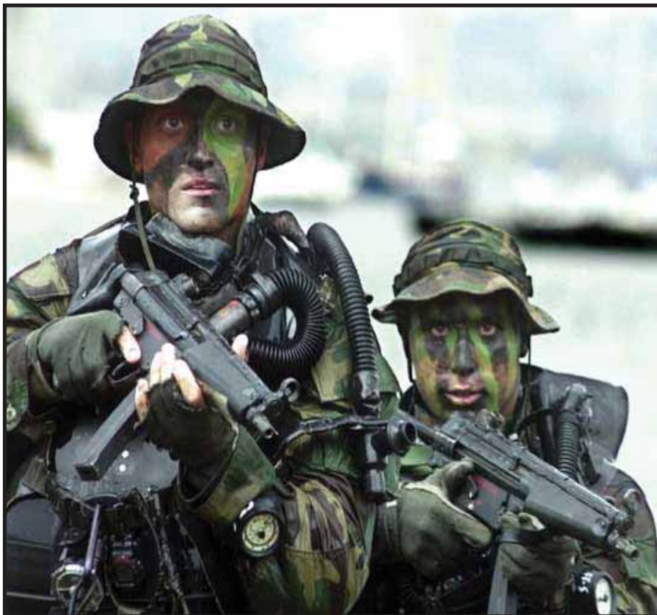
Un comando Seals ejecutó a Osama Bin Laden

En la guerra contra el movimiento Talibán, tanto en Afganistán como dentro de Paquistán, Estados Unidos está ensayando nueva tecnología militar, que presiona al