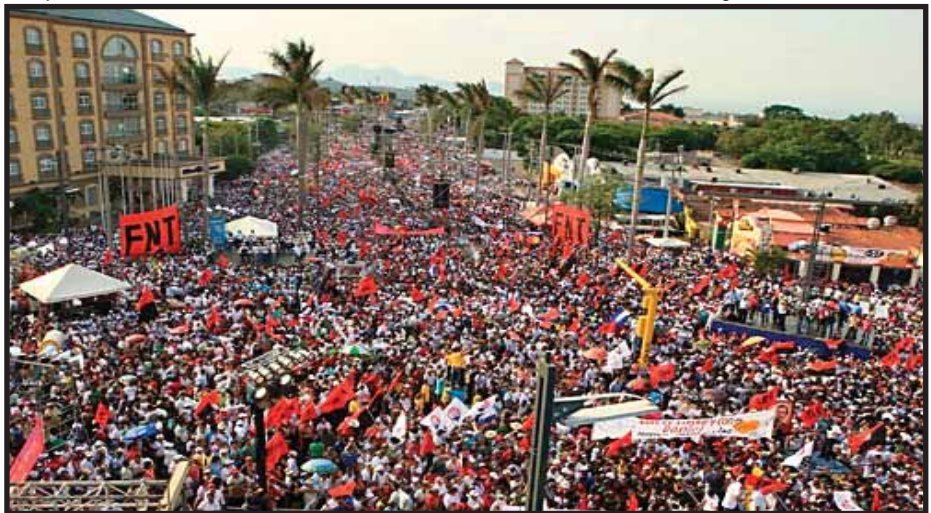
Acto oficialista el 29 de abril

Con el aumento del monto del "Bono Cristiano, Solidario y Socialista", los trabajadores públicos beneficiados obtienen alrededor de 30 dólares más, lo que realmente viene a mitigar el alza del costo