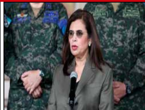
GUATEMALA.- Alianza de Arévalo con la derecha logra ampliar presupuesto