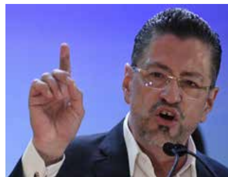
COSTA RICA.- A dos años de gobierno se acentúa el conflicto interburgués