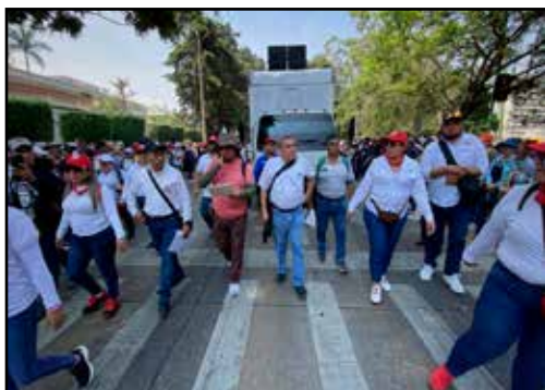
GUATEMALA.- Arévalo ataca al corrupto Joviel Acevedo para debilitar al STEG