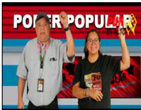
HONDURAS.- Encuentro Nacional de Luchadores 2024