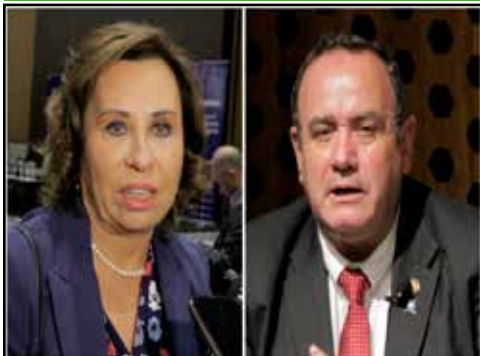
GUATEMALA.- Régimen se prepara para las elecciones del 2023