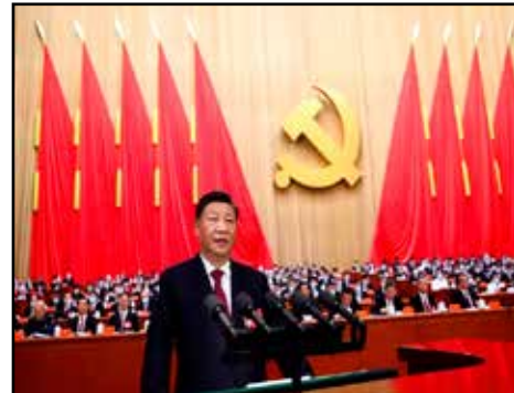
CHINA.- Estados Unidos y el 20 Congreso del Partido Comunista Chino