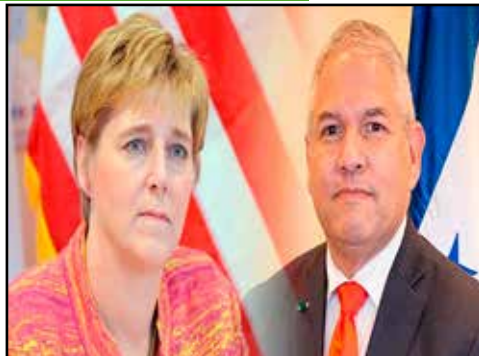
HONDURAS.- Agresivo discurso de Laura Dogu alienta a la derecha golpista