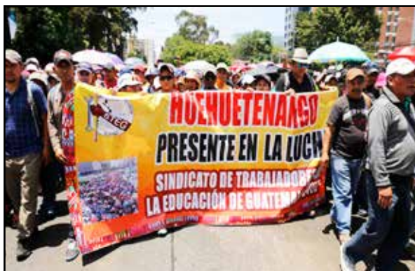
figura como sindicato proponente el Steg, y como sindicatos firmantes otros seis sindicatos miembros de la ANM.

El documento aún no ha sido homologado, y por tanto aún no es un acuerdo oficial entre el Mineduc y los sindicatos. El acuerdo, de ser firmado por ambas partes, tendrá una vigencia de dos años a partir de 2023, y en él