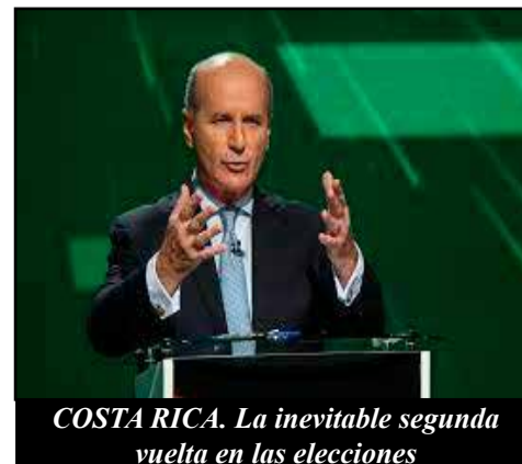
COSTA RICA. La inevitable segunda vuelta en las elecciones