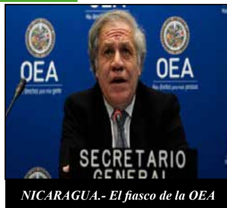
NICARAGUA.- El fiasco de la OEA