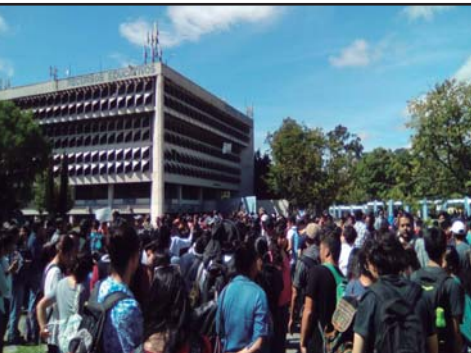
GUATEMALA.- Nueva vanguardia se plantea rescatar la AEU