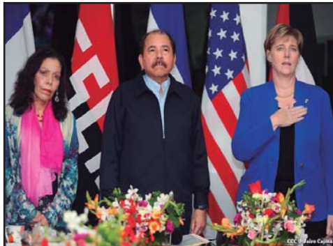
NICARAGUA.- Nic-Act presiones económicas para reformar el régimen