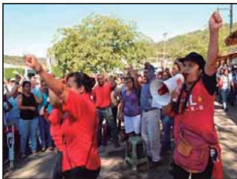
GUATEMALA.- Trabajadores de la salud no paran de luchar

III CUMBRE DE CELAC: REACOMODOS, FRICCIONES Y CRISIS DEL NACIONALISMO BURGUES