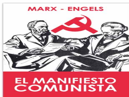
FECHAS.- A 167 años de la publicación del Manifiesto Comunista