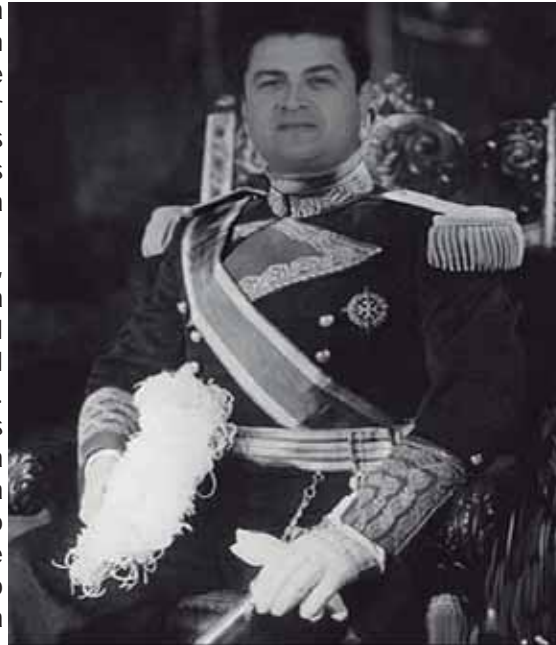
¿JOH el Dictador?