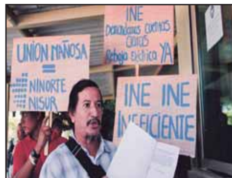
NICARAGUA.- Dura lucha para bajar los precios de la energía