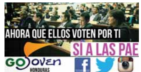
Una de las campañas digitales de organizaciones juveniles a favor de la ley que permita el uso de las PAE

Asimismo, este es un problema de clase, mientras las hijas de la burguesía tienen la posibilidad de irse a un país que permita abortar cuando deseen interrumpir un embarazo, somos las mujeres de la clase trabajadora las que tenemos que soportar una legislación que no nos permite siquiera decidir sobre nuestro cuerpo. Por ende llamamos a todas las organizaciones dispuestas a luchar por los derechos de la mujer a movilizarse no solo para la legalización de las PAE, sino para reformar toda la legislación y sea legalizado las PAE y el aborto legal seguro y gratuito. ■