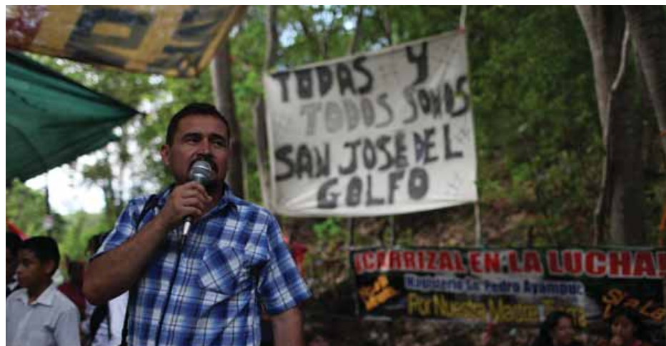
Resistencia popular contra la minería en San José del Golfo

En conclusión, informar es distinto que comunicar, pues lo primero tiene un discurso construido que refleja los intereses de las élites burguesas del país; mientras que el hecho de comunicar busca construir discursos críticos, que, tal como hace el PSOCA, busca hacer ver que las luchas locales y sectoriales deben avanzar hacia la unidad para construir instrumentos que derroten las políticas capitalistas y que por medio de la construcción de poder popular -como localmente se realiza- se dispute el poder a la distintas facciones de la burguesía.