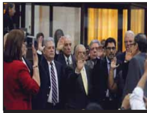
NICARAGUA.- Se mantiene el Statu Quo