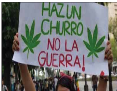
GUATEMALA.- La propuesta del gobierno para legalizar las drogas