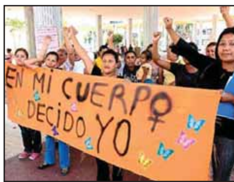
HONDURAS.- Las PAE y el derecho de las mujeres a decidir sobre su cuerpo