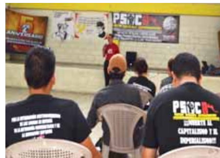
Parte de los participantes de la actividad y la decoración de esta gran fiesta