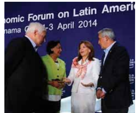
Pérez Molina con otros gobernantes en el Foro Económico de América Latina

John Kelly contestó en declaraciones a la prensa, al finalizar la Conferencia de Seguridad Centroamericana , que la legalización no tiene sentido. "En cada uno de los países que el día de hoy han legalizado o despenalizado el uso de droga o que están ignorando el flujo o uso de droga, el crimen no se reduce, de hecho aumenta, y el abuso no se reduce y se incrementa..." "El costo social asociado