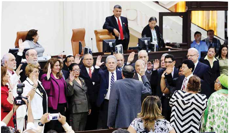
Con 62 diputados el FSLN logró imponer su hegemonía en todas las instituciones del Estado

De esta manera el presidente Ortega presenta hechos consumados, con muy poco espacio para hacer concesiones. La principal demanda de los obispos en el último periodo ha sido que se respete la institucionalidad.