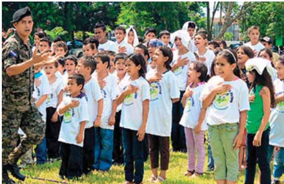
El gobierno de Juan Orlando Hernández pretende controlar la rebeldía de los jóvenes

Pocos meses han pasado desde que asumió la presidencia Juan Orlando Hernández , pero en este corto periodo en el poder ya ha pasado a la historia como el presidente que ha vendido parte del territorio nacional, desarticulado y los derechos de los y las trabajadoras y que, por lo menos de palabras, a “desarticulado el crimen organizado”. Hoy por hoy, Honduras es un país en el que las contradicciones sociales afloran cada día. Entre el gobierno anterior y este, se han perdido conquistas históricas y se avanza a pasos agigantados en la venta de las empresas del Estado desarticulando al mismo tiempo derechos sindicales. Desde el gobierno de Porfirio Lobo Sosa hasta este gobierno, los salarios se han congelado, y por si fuera poco, la carga impositiva ha aumentado considerablemente. Sin contar, con que a pesar de que el gobierno mantiene una campaña constante para hacer creer a la sociedad que los índices de violencia han disminuido, las estadísticas son categóricas, Honduras sigue siendo el país con más índices de muertes violentas en todo el hemisferio occidental. Todo esto vuelve a Honduras una olla de presión que en cualquier momento puede descomprimirse.