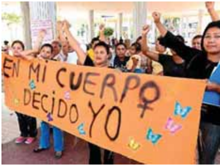
Organizaciones sociales se manifiestan a favor de la implementación de la ley