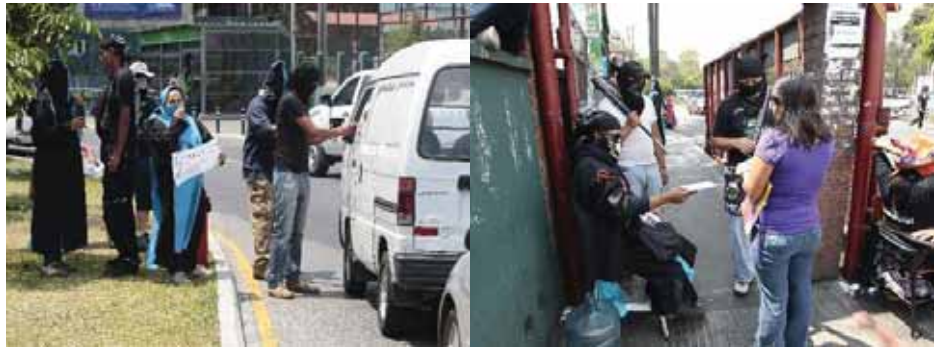
Huelgueros y zopes cobran colaboración obligatoria y el ingreso en la USAC

Efectivamente, así lo hicieron; regresaron armados con bates, y otras armas a hacer una labor de reconocimiento hacia distintos estudiantes que participaron