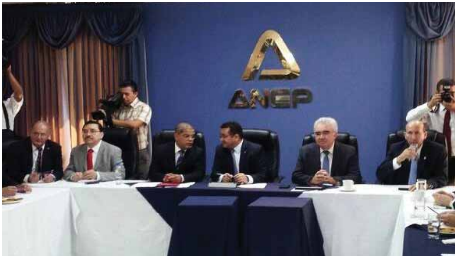
Inicio de las negociaciones de amplia alianza del nuevo gobierno aburguesado

Según declaraciones que dieron dirigentes empresariales de la ANEP después de la reunión con representantes del Gobierno recién electo, ellos consideran que "hasta hoy es que se ha iniciado un diálogo con el sector empresarial y el público" , considerando al gobierno de Funes como "confrontativo y excluyente" . Al respecto, Funes de manera contradictoria ha manifestado: "Da la impresión que el diálogo ahora es que comienza...que su gobierno fue quien 'rompió con el esquema oligárquico' que antes dominaba en el país...Estoy convencido que el nuevo Presidente electo (Salvador Sánchez Cerén) continuará con este esquema antioligárquico" . Las declaraciones del presidente Funes son contradictorias; por un lado se presenta como el gobierno que inicio el diálogo, pero por otro como un gobierno antioligárquico. Habrá que ver