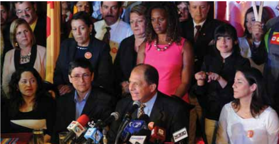
Luis Guillermo Solís será el futuro presidente de Costa Rica... ¿Cumplirá sus promesas?

nuestro alcance para colaborar" (Extra 7/4/2014).