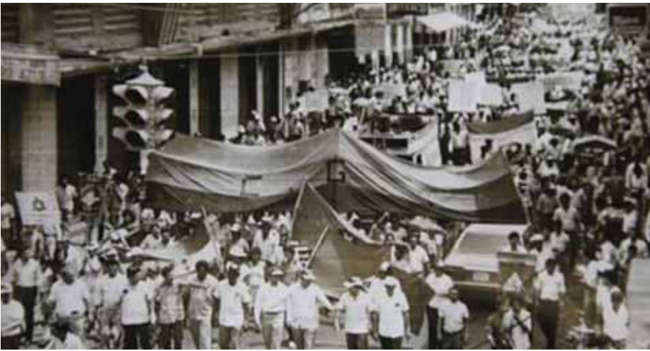
Manifestaciones callejeras durante las actividades de la huelga de 1954

reformista de Juan Manuel Gálvez. La gestión de Gálvez inició un plan de reformas económicas y una pequeña diversificación económica amentando las exportaciones de café y manufactura nacional. Pero estas mejoras económicas no se tradujeron en un mejor nivel de vida de los trabajadores, sino todo lo contrario: “En 1954 era obvio, que los beneficios del crecimiento económico no favorecían a la mayoría de la población hondureña; por el contrario, los trabajadores urbanos se quejaban cada vez con mayor intensidad, incluso en los años que precedieron al de 1954, por las miserables condiciones en las que vivían. Los salarios se habían estancado y su capacidad adquisitiva se había reducido drásticamente. La espiral inflacionaria, que recrudesció en los primeros meses de 1954, intensificó la protesta de los trabajadores urbanos y reavivó sus interés por la organización laboral.” (Ídem) Cualquier parecido a la realidad que vive Honduras en estos años, es pura coincidencia.