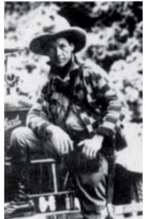
4 de Mayo de 1927 inicio de la lucha por la autodeterminación nacional.- Fechas (Pág 22)