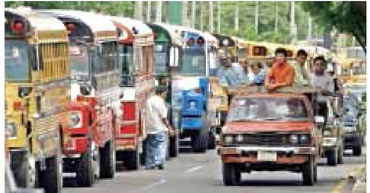
Transportistas doblegan al gobierno de Ortega-(Pág 12)

¡¡ NACIONALIZACIÓN DE LA INDUSTRIA DE REFINACIÓN Y COMERCIALIZACIÓN DEL PETRÓLEO!!