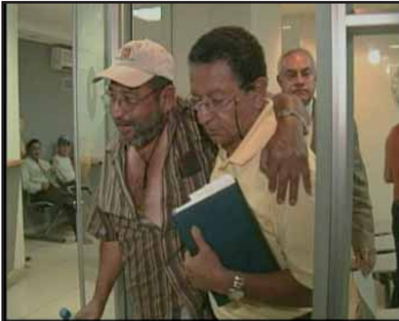
Piloto recupera su libertad después de ser apresado por las fuerzas represivas del gobierno de Álvaro Colóm.

Con ello, Colóm demuestra una y otra vez mas las intenciones del gobierno de turno que representa los intereses políticos y económicos de la oligarquía terrateniente-agroindustrial y comercial guatemalteca, lacayos del imperialismo norteamericano y Europeo en complicidad con la Municipalidad de Guatemala, administrada y controlada por el señor Álvaro Arzu, dueño del Banco Banrural, accionista del Banco industrial y demás negocios lucrativos sucios manchados de sangre y sudor del pueblo trabajador de Guatemala.