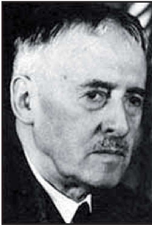
Henry L. Stimson

en la guerra civil de 1926 a favor del gobierno conservador. Mientras las tropas norteamericanas apuntaban a los gobiernos de la llamada "segunda república conservadora" (1912-1928), al mismo tiempo entrenaban y apertrechaban a la Constabularia compuesta por soldados nicaragüenses