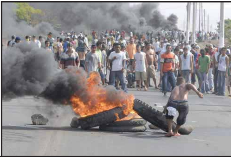
La población de la comarca "Las Maderas" salió a la carretera a enfrentarse a la Policía.

Los paros de transporte del año 2004 y 2005 fueron muy cortos, debido a que el gobierno de Enrique Bolaños, temeroso de enfrentar el pacto Ortega-Alemán, cedió casi todas las demandas del sector transporte. Entre 2001 y 2004 no hubo subsidio al sector transporte, pero a partir del paro del año 2004 el transporte urbano de Managua fue subsidiado anualmente por la cantidad de 10 millones de dólares. En el sector interurbano, el