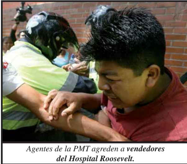
Agentes de la PMT agreden a vendedores del Hospital Roosevelt.

Otro caso más de las políticas antipopulares de Arzú es el siguiente. Con el propósito de convertir el Centro Histórico de la capital en un lugar de paseo y diversión para los turistas y las clases pudientes, la alcaldía, en