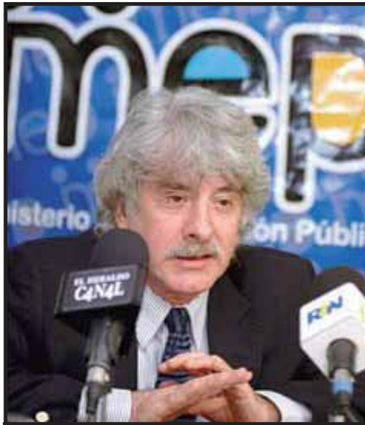
El ministro de Educación, Leonardo Garnier .

Las demandas de la huelga eran las siguientes: pago oportuno y completo del salario; equiparación salarial con profesionales del gobierno central; aplicación del concurso docente del año 2007; aumento salarial para el sector no profesional de educación; disminución del número de alumnos