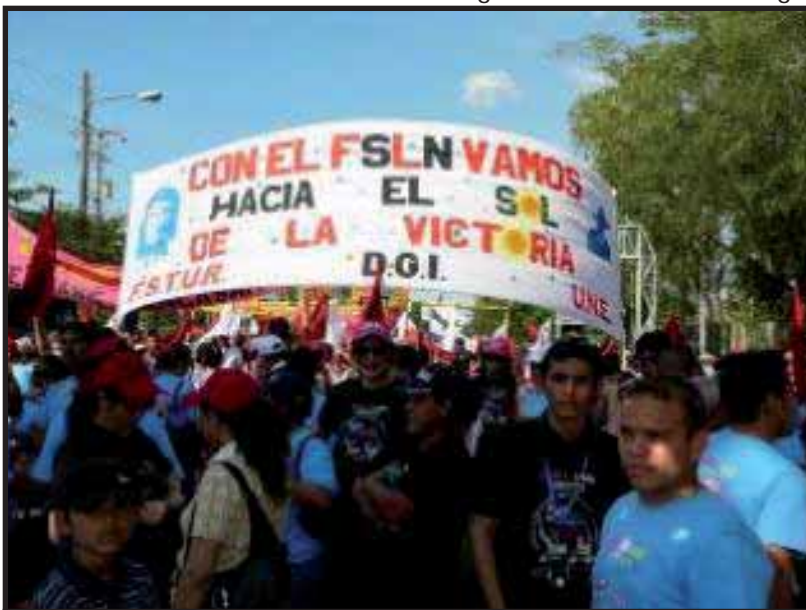
El 30 de abril se llenó la Plaza de la Revolución con empleados públicos.

(...) y ahora, el cuento es 'sindicatos blancos, sindicatos blancos' y, ¡somos Sindicatos Rojo y Negro, somos Sindicatos Sandinistas! Y este, es nuestro Gobierno y lo vamos a defender."