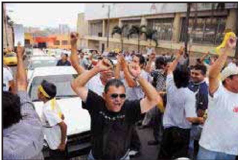
Marcha en solidaridad con los Fiscales en Huelga de hambre.

jurídico está construido para que estos magistrados llegaran a sus puestos a través de negociaciones previas, en donde se reparten: el número de instituciones, el número de Diputados y el número de magistrados que le toca manipular a cada empresario hondureño.