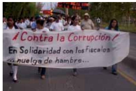
Huelga de Fiscales.- Honduras (Pág. 18)