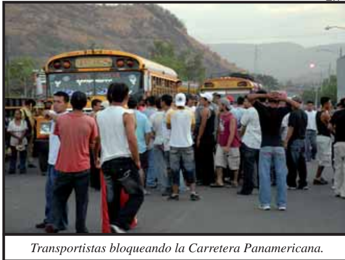
Transportistas bloqueando la Carretera Panamericana.

Después de la derrota de 1997, los transportistas reclamaron una reducción en el precio del diesel que en a inicios de 1999 había aumentado a 16.50 córdobas ($1,50) el galón.