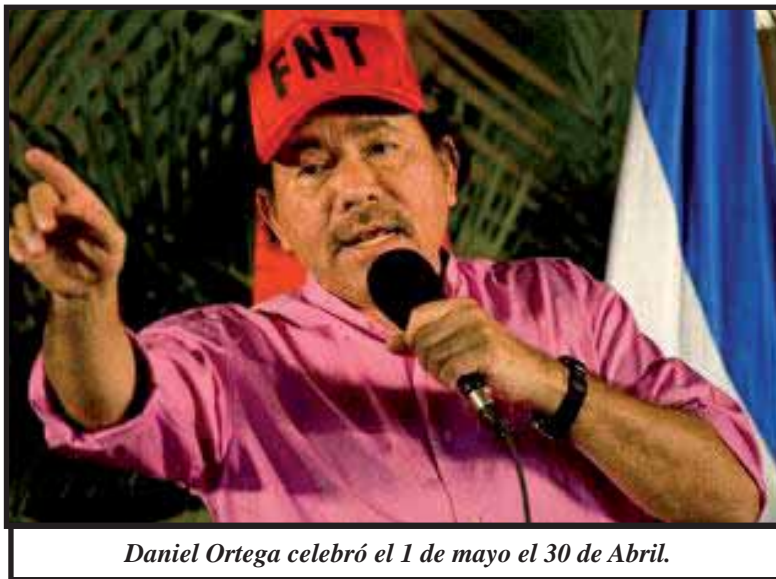
Daniel Ortega celebró el 1 de mayo el 30 de Abril.

El FSLN pretende engañar al pueblo con rimbombantes cifras, las que son negadas por la realidad misma, que señala que las plazas de empleos se reducen cada día, y la sofocante situación económica hace que el salario de los trabajadores sea cada vez más miserables.