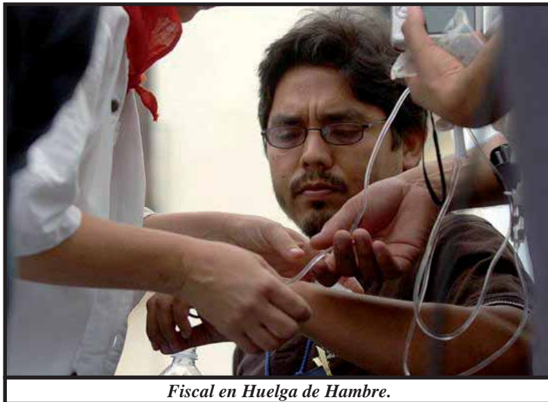
Fiscal en Huelga de Hambre.