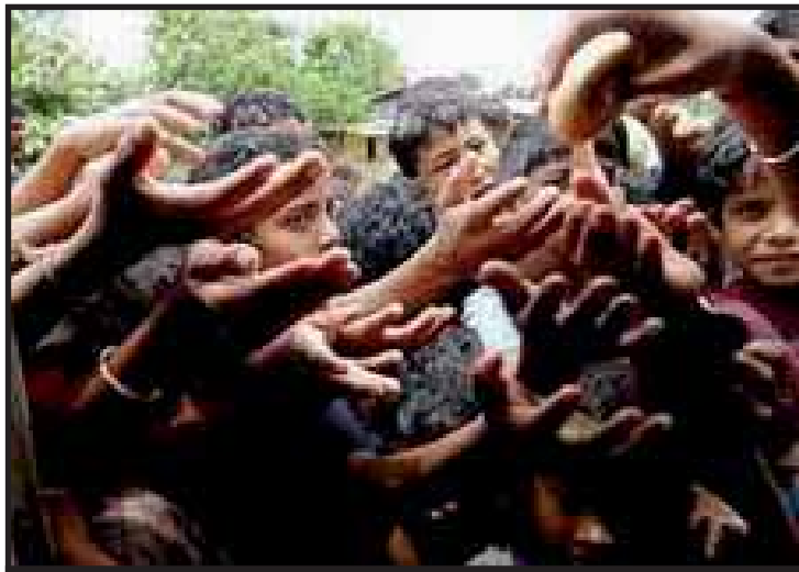
La hambruna mundial es una realidad.

países emergentes, como China e India, con enormes poblaciones, que "con el crecimiento de sus economías y de sus ingresos han ido diversificando su dieta y han puesto más presión sobre la producción mundial de cereales". (BBC 15/04/08) En este mismo sentido, José María Sumpsi Subdirector General de la FAO, apunta a que: "Hay países como China o India, que suponen el 40% de la población mundial, donde antes la gente se alimentaba con un tazón de arroz. Ahora, su nivel de vida ha aumentado, y quieren un filete. Esta demanda, sumada al aumento de población y los altos precios, da como