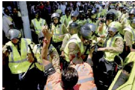
Represión contra los trabajadores informales.- Guatemala (Pág 08)

¡El capitalismo nos lleva a la barbarie!