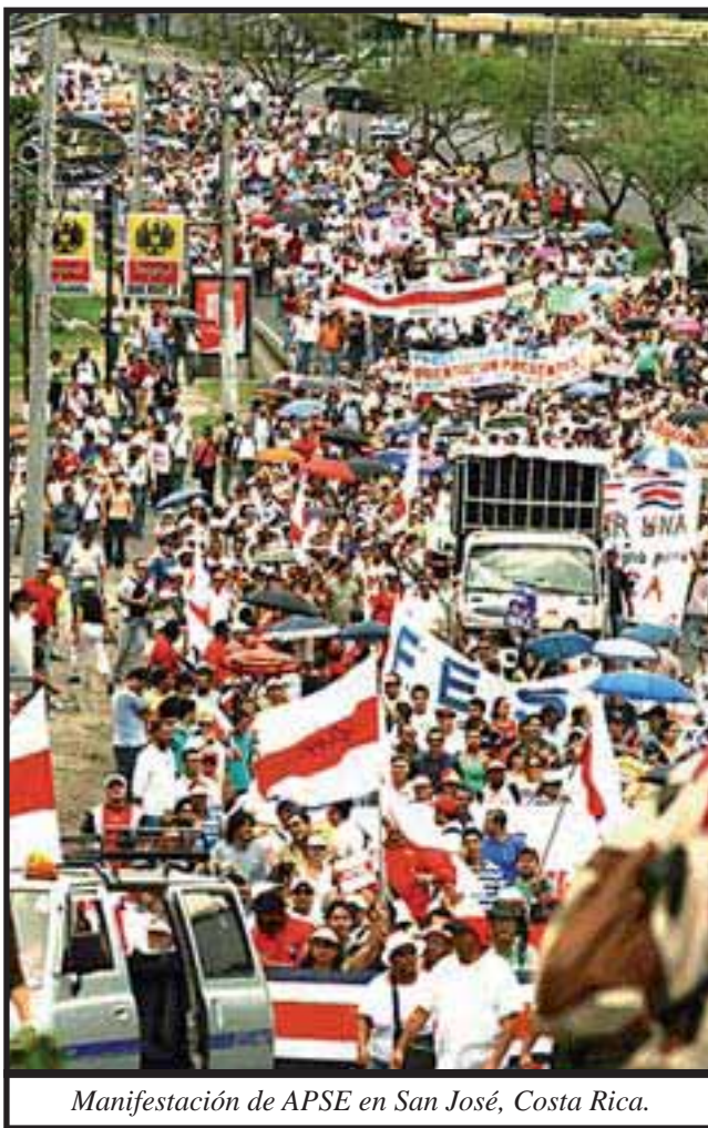
Manifestación de APSE en San José, Costa Rica.

participación de los docentes en el movimiento huelguístico, que constituye todo un fenómeno político y sindical, también se explica por las justas demandas de la huelga, así como porque la lucha por la equiparación salarial de los educadores con respecto a los demás profesionales del gobierno central, en el fondo, es una lucha por aumentos salariales, independientes de los ajustes semestrales por inflación,