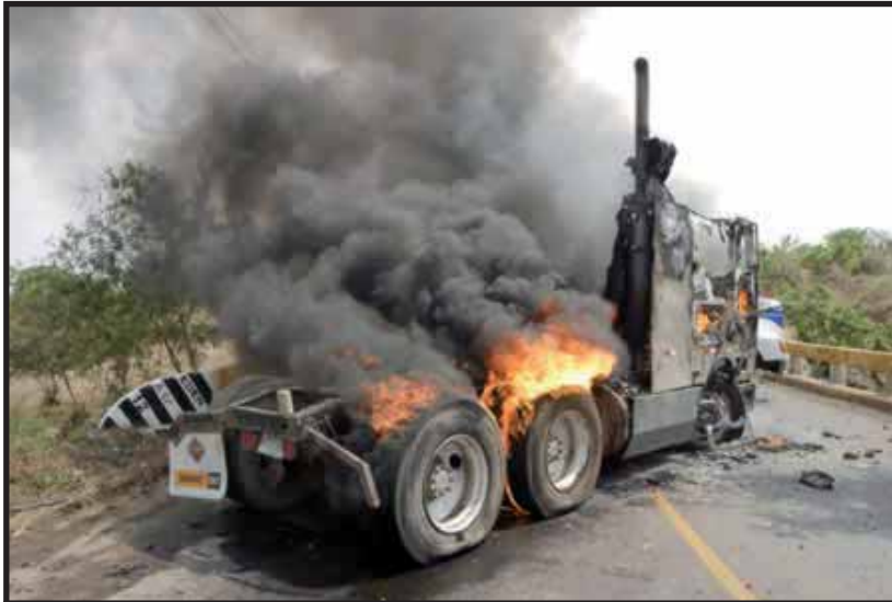
Transportistas incendiaron dos cabezales de esquirolas en el empalme de "San Benito"

Loquetransportistas lograron a través de la lucha, puede disolverse rápidamente debido a que los precios del petróleo continúan subiendo. Este subsidio abarracará un sector reducido de la flota vehicular, los restantes continuaremos pagando los altos precios que van a parar a manos de las transnacionales petroleras.