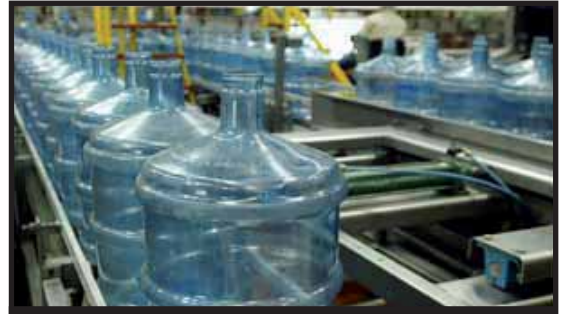
Los Castillo son uno de los grupos empresariales más poderosos de Guatemala.

Las exigencias del sindicato son claras, primero y más importante su reinstalación, después su estabilidad laboral y la negociación de convenios colectivos, mejoras salariales y condiciones laborales justas. Se está esperando la resolución del Ministerio de Trabajo que debe ser el reinstalo