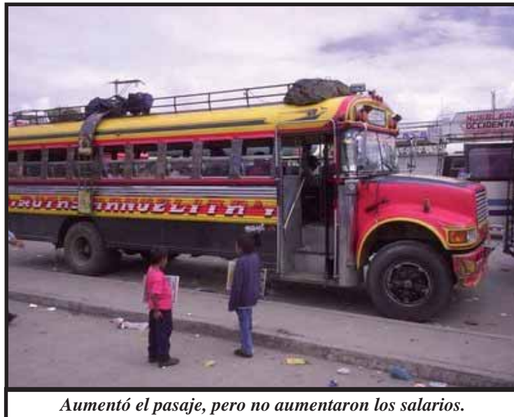
Aumentó el pasaje, pero no aumentaron los salarios.

Amas de casa, miembros de la tercera edad, y la económica informal, son el vivo ejemplo de la dialéctica social, por de pronto y observemos como este sistema explotador continua alimentando su propia bomba de tiempo, la cual es una construcción social, porque el pueblo esta cansado y la miseria cobra a diario su tasa de interés. ■