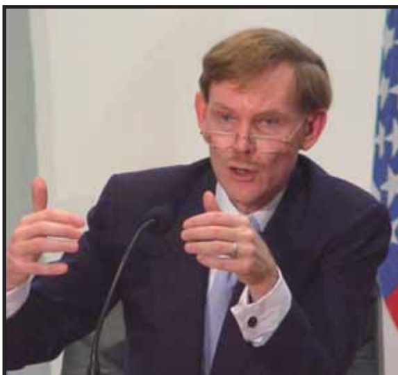
Robert Zoellick, Presidente del Banco Mundial.

Aunque este tema espante a Lula, el hecho es que no deja de tener en cierta forma razón, los biocombustibles: "Según estudios de la FAO y de otros organismos internacionales, entre 2006 y 2007 han tenido una contribución a la subida de los precios de entre el 5% y el 10%. Eso se ha juntado con otros factores. Ahora bien, de cara al futuro, si Estados Unidos o la Unión Europea siguen convirtiendo más y más producto agrario en