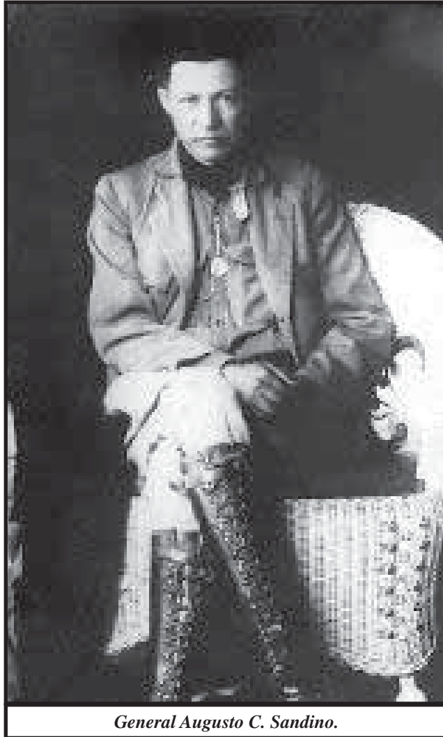
General Augusto C. Sandino.

En realidad, como toda guerra, se libró una lucha cruel, en la que Sandino representaba el bando más progresivo, que luchaba por la expulsión de las tropas imperialistas y por la autodeterminación nacional. El ejército norteamericano y la Guardia Nacional controlaba la zona del pacífico, la zona central y gran parte de la costa Caribe. El ejército de Sandino, en cambio, estaba limitado a