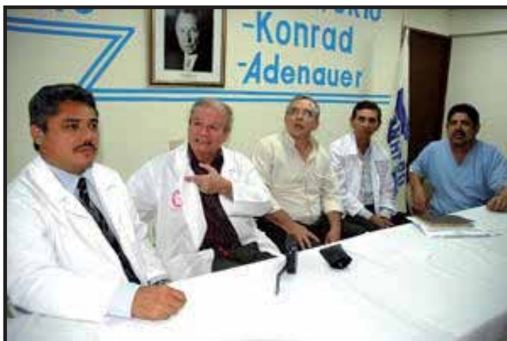
La dirigencia del Movimiento Médico Pro Salario ha sido amenazada con represalias por parte del MINSA.

Como mencionamos en artículos anteriores del Socialista Centroamericano, el gremio de médicos Pro salario lleva más de dos meses, luchando por el cumplimiento de la ley de equiparación salarial, norma que homologa los salarios de los galenos, al de sus pares en el resto