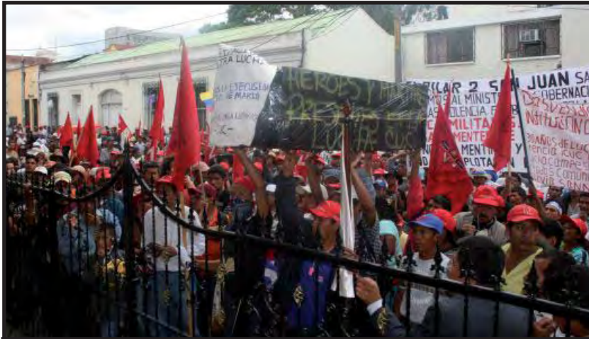
Marcha campesina del CUC frente a Casa Presidencial.

Durante la marcha organizada por el CUC con motivo de su 30 aniversario, los campesinos exigían al gobierno de Colom que fuera realmente socialdemócrata, como se anuncian (Diario Prensa Libre 15/4/08). A los compañeros campesinos nosotros les decimos que la corriente socialdemócrata no es una corriente revolucionaria. La socialdemocracia propone maquillar el sistema de explotación capitalista sin destruirlo, lo que en última instancia quiere decir que, cuando llegan al gobierno, entran en componendas con la burguesía y los sectores poderosos. El gobierno de Colom está reprimiendo las