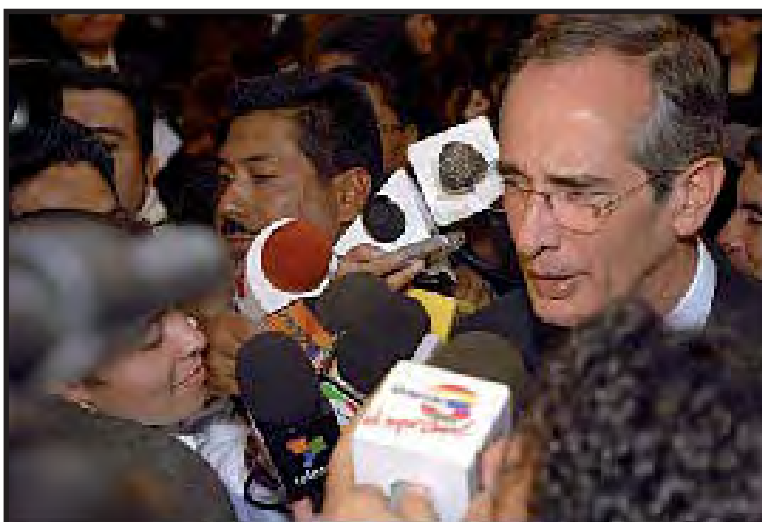
El Presidente Álvaro Colom anuncia el acuerdo sobre los precios del gas.

del petróleo y cereales revertirán la tendencia de crecimiento de la economía. Esto incluye el monto de las remesas enviadas por trabajadores migrantes a sus familias, que fue de US$ 4,128 millones en 2007, casi igual a las exportaciones, US$ 4,219 millones (cifras del Banco de Guatemala publicadas en el diario El Periódico