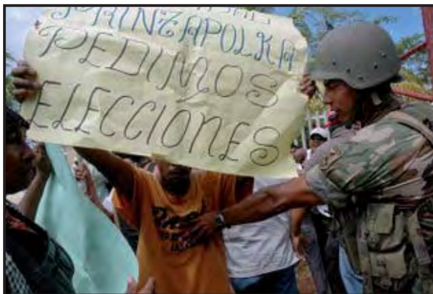
Manifestacion en Bilwi en contra de la suspension de las elecciones municipales.