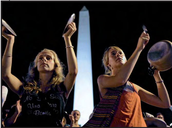
Las cacerolas volvieron a sonar en protesta por el desabastecimiento de alimentos en las ciudades.

una economía sólida y en crecimiento, sin embargo la situación objetiva difiere de la postura oficial, pues si bien es cierto la economía está próxima a alcanzar cinco años consecutivos con un superávit fiscal, esta "bonanza" pareciera ser ficticia, pues: "Para poder mantener a pleno rendimiento la máquina exportadora -y por tanto recaudatoria- es necesario que la moneda nacional, el peso, tenga poco valor." (Ídem), lo que ha forzado a que el Gobierno argentino no evite comprar dólares; pues esto provocaría la apreciación del peso reduciendo las exportaciones y sus ingresos.