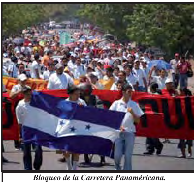
Bloqueo de la Carretera Panaméricana.

Las actividades comenzaron desde la mañana, se llevaron a cabo en La Ceiba, Potrerillos, Cortés, Tegucigalpa, Comayagua, Siguatepeque, El Paraíso, Danlí, Choluteca, La Entrada, Santa Rosa de Copán, Juticalpa, Santa Barbara, Tocoa, San Pedro Sula, El Progreso y Tela. Estas albergaron aproximadamente unas 50,000 personas en las 17 ciudades que mencionamos anteriormente, en donde se realizaron las actividades programadas por la CNRP. Esto, es sin lugar a dudas es un buen paso de cara a la reactivación de la Coordinadora Nacional de Resistencia Popular, que ahora encara de manera unitaria con las Centrales Obreras, las luchas en contra de las medidas neoliberales del gobierno de Mel Zelaya.