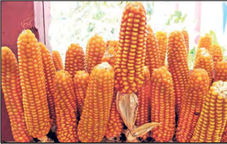
El maíz se importa a precios cada vez mas altos.

recursos a los sectores más vulnerables (transferencias condicionadas, etc.), y por supuesto, que los salarios no deben subir al ritmo que los alimentos, por los efectos inflacionarios.