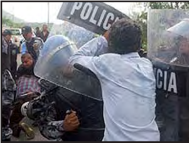
La Policía reprimió a los manifestantes.

Las expectativas que generó el Paro Cívico Nacional, conjuntamente con la propaganda hecha por los medios de comunicación y las perspectivas al interior de La Coordinadora, fueron mancilladas, pues no se obtuvo respuesta a los 12 puntos, al contrario, el gobierno ofreció garrotes y gases lacrimógenos en casi todos los puntos que habían manifestaciones, en ningún momento hubo un asomo de diálogo por parte del presidente, que