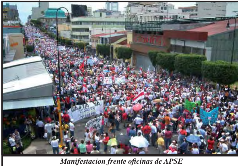
Manifestación frente oficinas de APSE