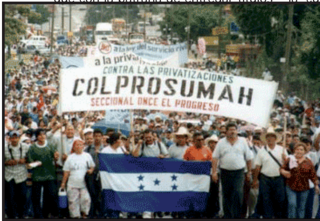
26 de Agosto de 2003, cuando Tegucigalpa fue tomada por los sectores en lucha.

Aquella marcha perseguía: “el veto presidencial a la Ley de Agua y Saneamiento, cuyo contenido central era la apertura a la privatización mediante el otorgamiento de concesiones. Parar la discusión en el Congreso las reformas a la Ley de Servicio Civil que derogaba las cláusulas salariales del sector público. Abolir la ley de Titulación de Predios, que con la patraña de entregar títulos