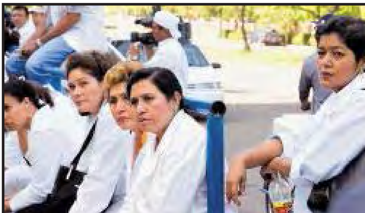
Médicos en Paro.

médicos, Guillermo González (Ministro de Salud) hizo un llamado a la población para que no atienda las declaraciones brindadas por el gremio de médicos Pro salario, las cuales dijo eran "cantos de sirena", de una organización que según él, no cumple con todos los requisitos legales para existir: "algunos tienen mas de cinco años sin realizar una sola sesión profesional, esto es un llamado a la anarquía, y ni siquiera cumplen con las ocho horas laborales". (Idem) Aunque las declaraciones de Guillermo González son muy "ilustrativas", esta claro que la posición del gobierno es represiva y no aúna en nada a la solución del conflicto, solo agudiza las condiciones ya precarias del sistema de salud nicaragüense.