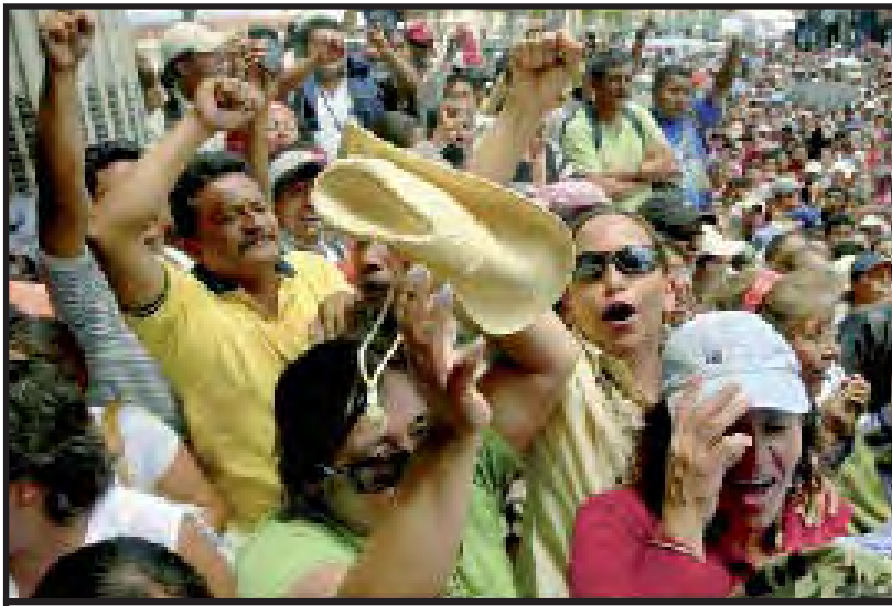
Maestros celebran la firma del Convenio con el Gobierno.

Recordemos que hay planes de reformas neoliberales en la educación heredadas del gobierno anterior, que no tenemos certeza que las actuales autoridades van a hacer a un lado. El plan de la anterior ministra era que la totalidad de los maestros estuviera bajo contrato, como están los