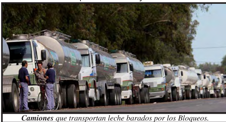
Camiones que transportan leche barados por los Bloqueos.

En el campo, la situación no fue diferente, en este sector, el gobierno se apoyó en Confederación General del Trabajo (CGT), específicamente el líder camionero Hugo Moyano. Los camioneros se