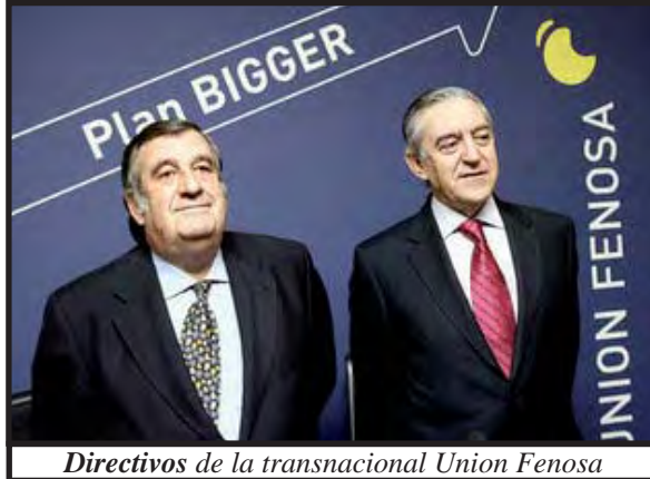
Directivos de la transnacional Unión Fenosa

sesión del 13 de marzo. Al momento de aprobar dicha ley en lo particular surgió la crisis creada con la resolución del Consejo Supremo Electoral que manda a suspender las elecciones municipales en tres municipios de la Costa Caribe (Bilwi, Waspam y Prinzapolka). La oposición de