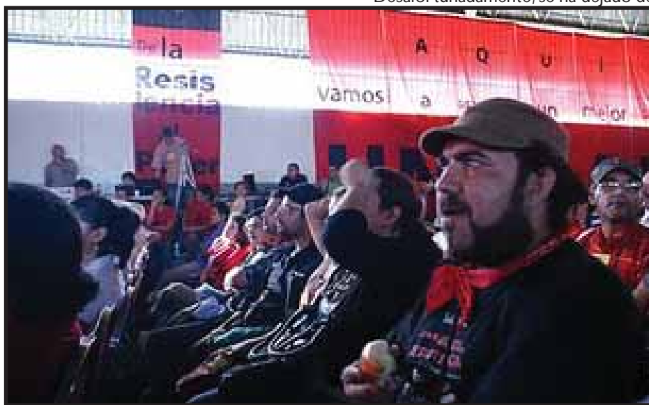
La Asamblea del FNRP reunió a 1,500 delegados

dirección del Frente que desde hace varios meses había iniciado -a veces de forma abierta- otras veces de forma disimulada y solapada la campaña para insertar al Frente en las elecciones de 2013. Frente a este giro apresurado de la dirección, distintas organizaciones sociales y políticas del FNRP conformamos un bloque de unidad de acción con la intención de alertar sobre el enorme peligro de participar en un proceso electoral sin garantizar las condiciones democráticas mínimas.