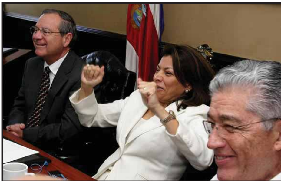
Laura Chinchilla escucha alborozada el fallo de la Corte Internacional

Corte Internacional de Justicia (CIJ), con sede en La Haya, Holanda, dictó un fallo salomónico que agradó por igual a los gobiernos de Nicaragua y Costa Rica.