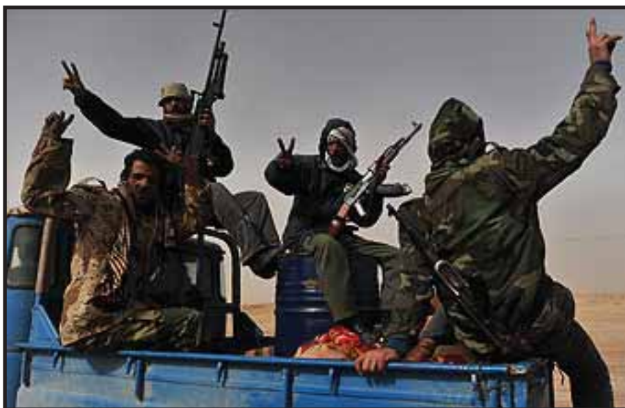
Rebeldes libios luchan contra Gadafi

Pero la relativa fortaleza de Gadafi no proviene de la amplitud de su base social, sino de la debilidad política del CNTP, de la ausencia de una conducción revolucionaria, y en cierta