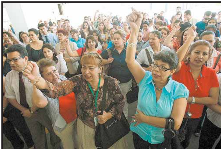
Los trabajadores del INPREMA luchan por sus derechos

a los docentes como son: sacar de la Ley de Ordenamiento Retributivo al Estatuto del Docente, la indexación al aumento del salario mínimo y el pago del PASCE como compensación, algo que Maduro no pagó.