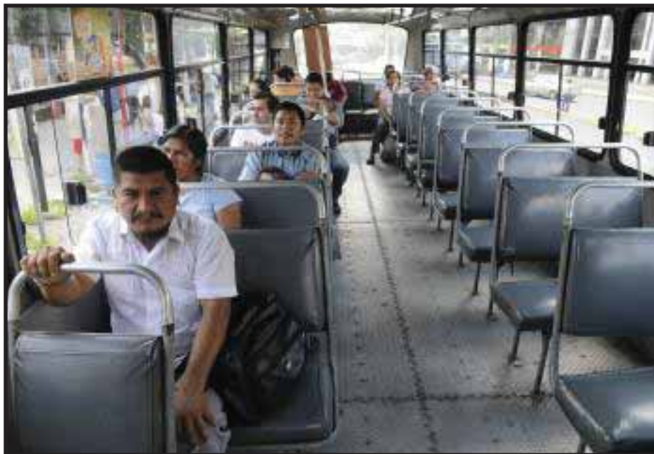
La ANEP quiere manejar el negocio del transporte público

El empresario salvadoreño y sus medios de comunicación parecían preocuparse por los usuarios del transporte público, lo cual era cosa extraña; últimamente el gran empresariado a mostrado la realidad dándose a conocer que lo único que busca es apropiarse y monopolizar el servicio del transporte público lo cual queda claro con la propuesta de un sistema concesionado de transporte público basado en el uso de autobuses articulados propuesta que recientemente fue lanzada por la Asociación Nacional de la Empresa Privada (ANEP) y según informara un medio de comunicación "Sobre los servicios del sistema masivo de transporte de pasajeros, como la boletería, la vigilancia y el mantenimiento, la gremial (la ANEP) indicó que la prestación de estos debería