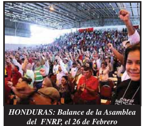
HONDURAS: Balance de la Asamblea del FNRP, el 26 de Febrero