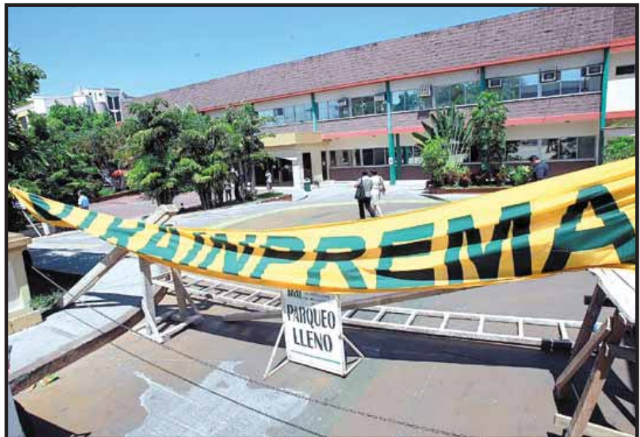
La lucha por el rescate del INPREMA y la defensa del Estatuto Docente, son las dos caras de una misma moneda

9.- Llamamos a la dirigencia del FNRP para que asuma el desafío de encabezar, junto a las colegios,