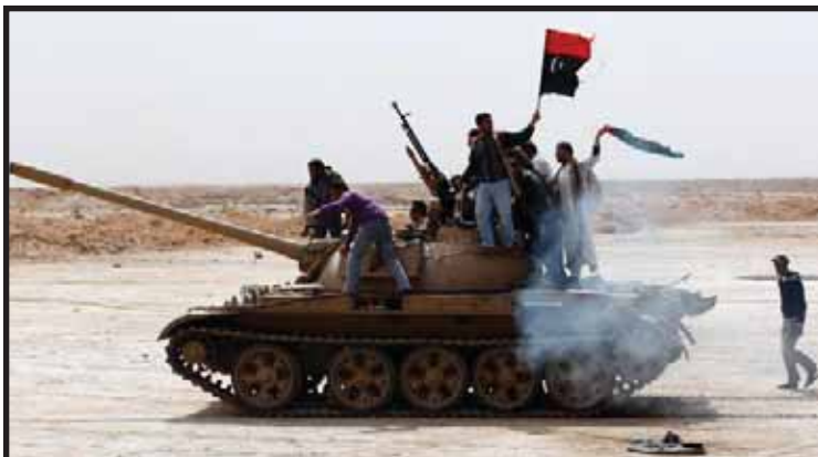
Los rebeldes pelean con menos armas

Está claro que en los últimos años, Gadafi se logró mantener por los acuerdos con el imperialismo. Por esta razón, ahora protesta y suplica volver al statu quo anterior.