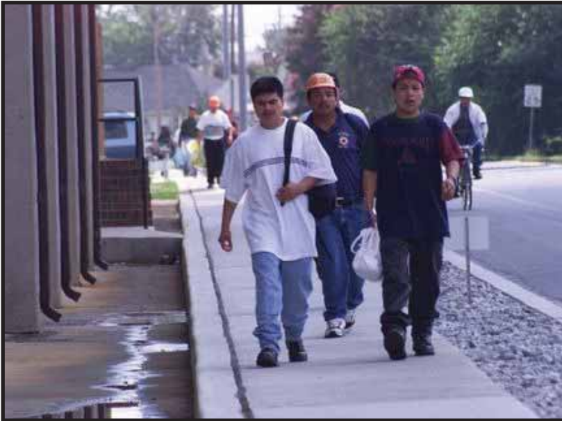
Trabajadores migrantes Guatemaltecos

El dinero que reciben las familias pobres de sus familiares que trabajan en Estados Unidos, ha servido como un