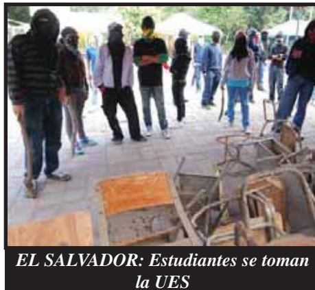
EL SALVADOR: Estudiantes se toman la UES