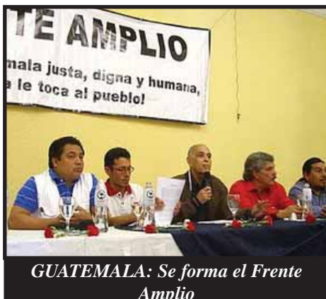
GUATEMALA: Se forma el Frente Amplio