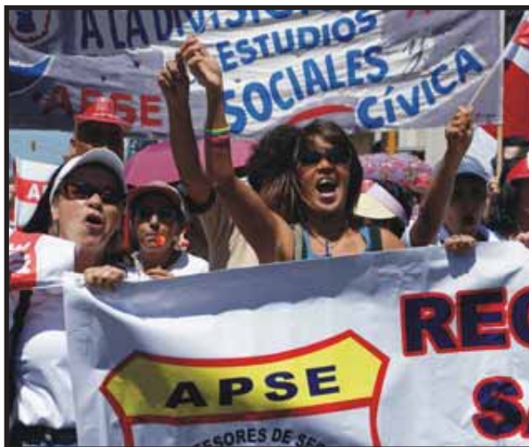
Los sindicatos del magisterio se hicieron presentes

Jose María Villalta, diputado del Frente Amplio, se hizo presente en la marcha y planteó en su discurso que "No es poniéndole más impuestos a la clase trabajadora como se va a solucionar el problema fiscal. No deberían ser los más débiles los que paguen los platos rotos de la crisis, debería ser una propuesta solidaria y