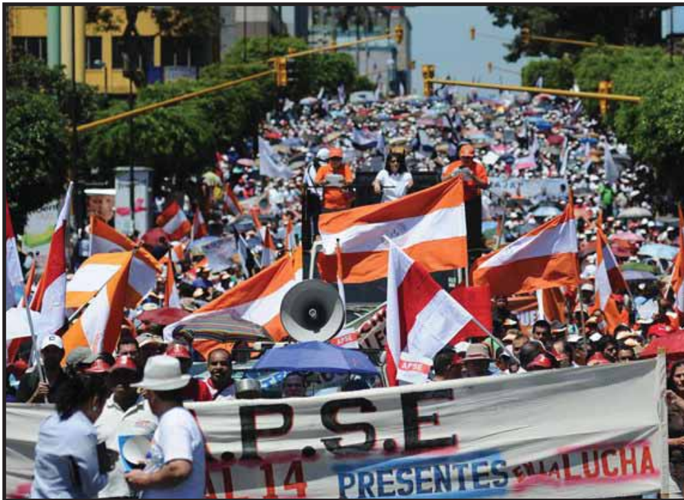
Marcha del 10 de marzo en San José

No hay duda que el éxito de la marcha del pasado 10 de Marzo se debió, en primer lugar, a la unidad de todas las centrales obreras y sindicatos del país. Como pocas veces hemos visto, esta unidad fue conformada por la Asociación de Profesores de Segunda Enseñanza