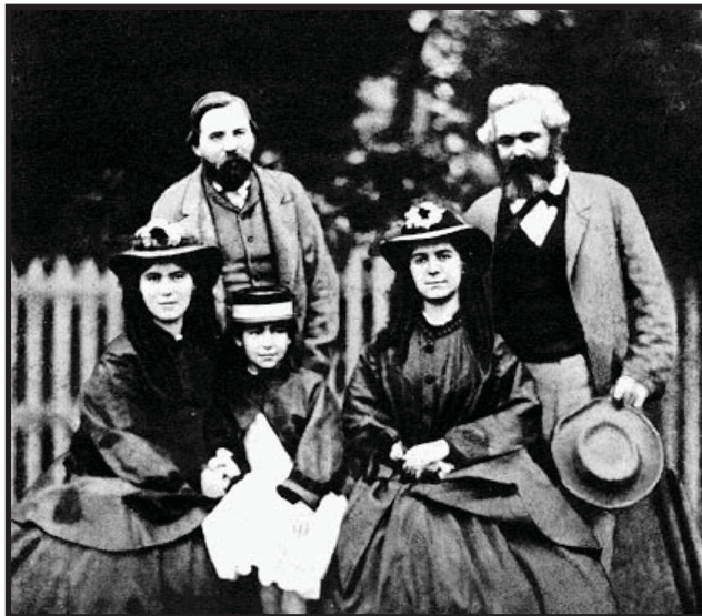
Federico Engels, Carlos Marx y su familia

Marx publicó "El 18 Brumario de Luis Bonaparte" y en 1853, escribió las "Revelaciones sobre el proceso de los comunistas en Colonia". Según Engels,