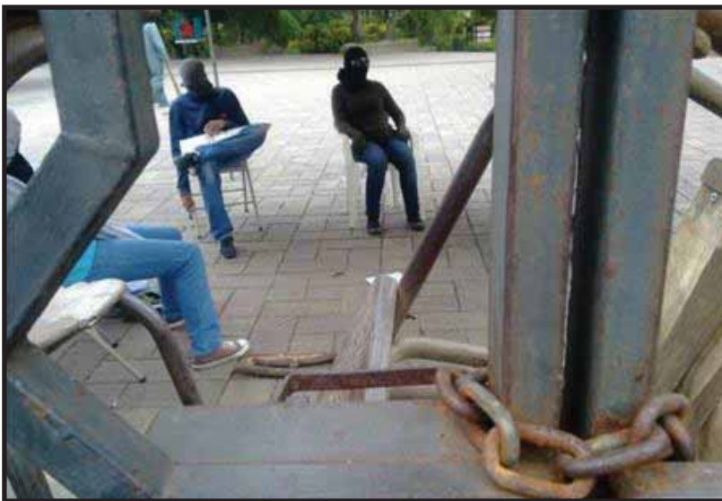
Los estudiantes rechazados se tomaron la UES, en señal de protesta

han manifestado que la admisión de estudiantes en la UES está condicionada por el exiguu presupuesto asignado por el Estado y Gobierno de El Salvador, que el ingreso universitario en el sistema público constituye un problema de naturaleza estructural, (Acuerdo de CSU No. 066-2009-2011E(III-1). Por lo tanto el PSOCA considera que una respuesta a favor de las grandes mayorías sería el facilitar el ingreso de los jóvenes a la UES y llamar a la organización y movilización para exigirle a la clase dominante y al gobierno mayores recursos para la UES a sí mismo realizar una mejor administración.