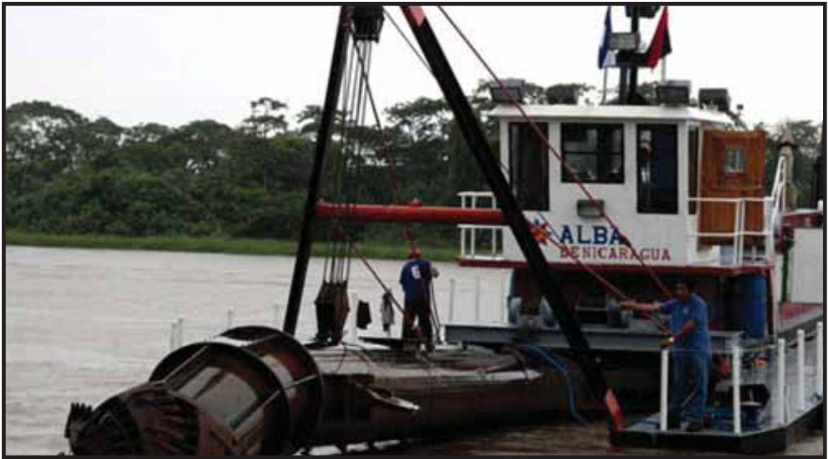
Dragas nicaraguenses trabajando en el río San Juan

El discurso triunfalista de Chinchilla fue criticado por el ex presidente Oscar Arias quien puso el dedo en la llaga sobre el asunto del dragado del río San Juan: "La Corte ha dado un primer paso en el camino correcto al exigir el retiro de los militares y civiles que ocupan isla Portillos. Si bien no podremos recuperar esa porción de nuestro territorio hasta el fallo sobre el fondo, el imperio de la razón empieza a recobrar terreno. La no suspensión de las