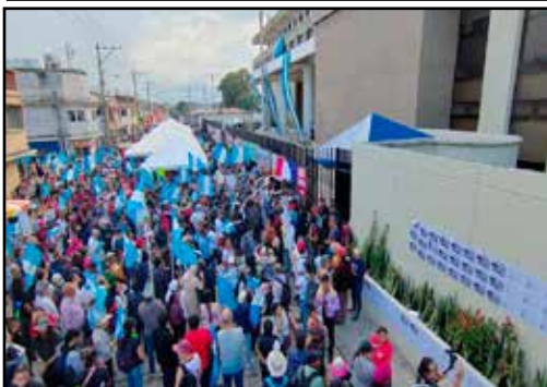
GUATEMALA.- Imparable ola de protestas en todo el país.