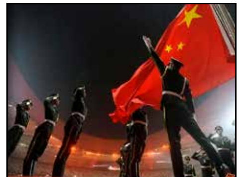
CHINA.- Ascenso y recuperación de un imperio humillado (I parte)