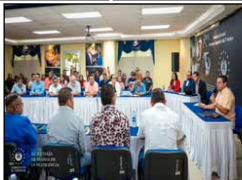
EL SALVADOR.- Un salario mínimo de $ 700 dólares para combatir la inflación