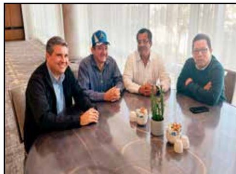
NICARAGUA.- Grupo Monteverde, nuevo difraz de la extinta Coalición Nacional