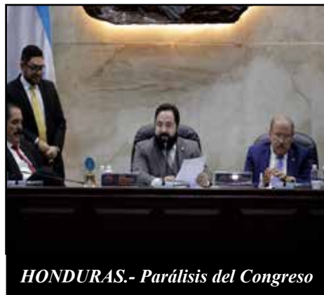
HONDURAS.- Parálisis del Congreso

17 DE JULIO DE 1842: LA DIETA DE CHINANDEGA CREA LA PRIMERA CONFEDERACIÓN CENTROAMERICANA