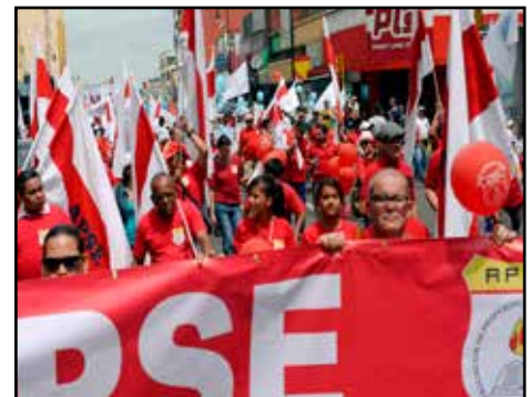
COSTA RICA.- Llamado a votar por la alianza entre “Cambiemos” y “Fuerza”