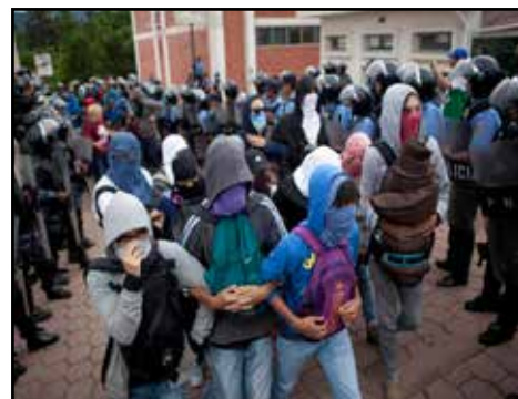
HONDURAS.- Crisis de la UNAH: de las generaciones rubustas a las Light