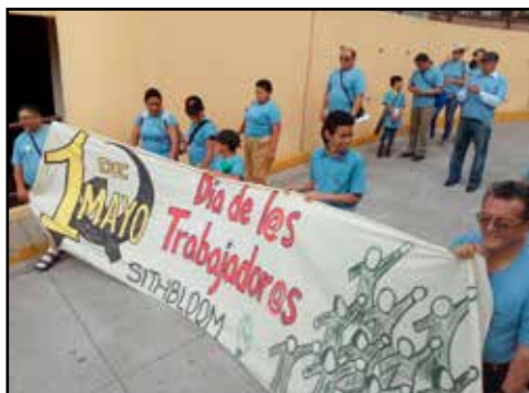
EL SALVADOR.- Carta Abierta a los Sindicatos: 15 puntos del plan de lucha