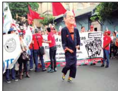
COSTA RICA.- ¿A quien beneficia la división sindical?