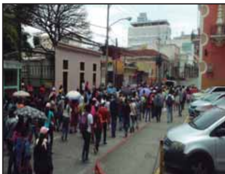
GUATEMALA.- Magisterio lucha por estabilidad laboral

GUATEMALA: LUCHA ESTUDIANTIL CONTRA LAS MAFIAS AL INTERIOR DE LA USAC