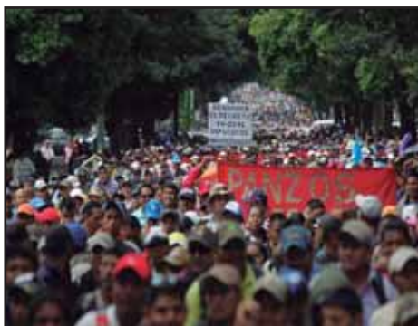
GUATEMALA.- Lucha del Magisterio hace retroceder al Congreso