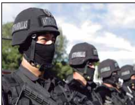
EL SALVADOR.- El gobierno del FMLN apuesta todo a plan de seguridad