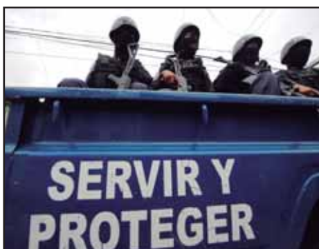
HONDURAS.- Disolver la corrupta Policía Nacional y crear Autodefensas

GUATEMALA.- ARTICULAR UN NUEVO MOVIMIENTO ESTUDIANTIL