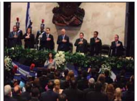
HONDURAS.- Bipartidismo forcejea por elección de nueva CSJ