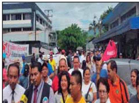
EL SALVADOR.- El salario mínimo debe cubrir la canasta básica