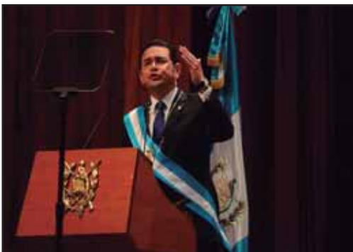
GUATEMALA.- Ni un minuto de descanso a Jimmy Morales!!