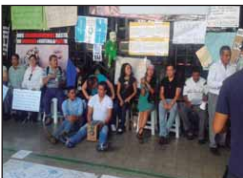
GUATEMALA.- Por un Paro General para echar al gobierno corrupto