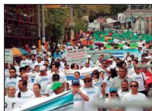
HONDURAS.- Balance del 1 de Mayo