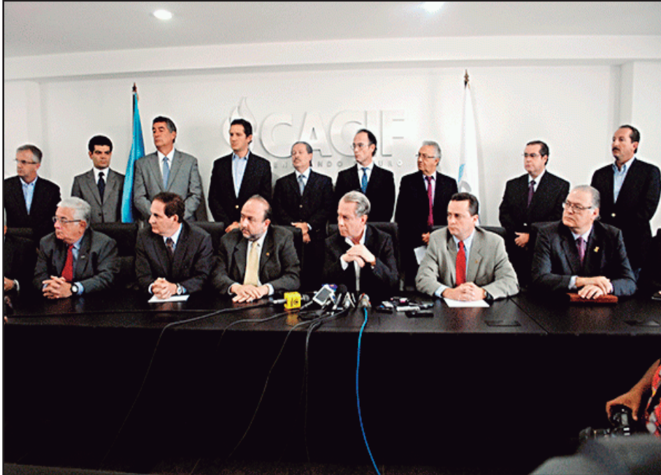
El Cacif pidió la renuncia de Baldetti