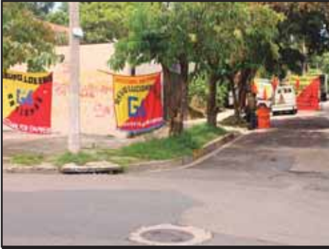
EL SALVADOR.- Patrones areneros violentan derechos de sus trabajadores