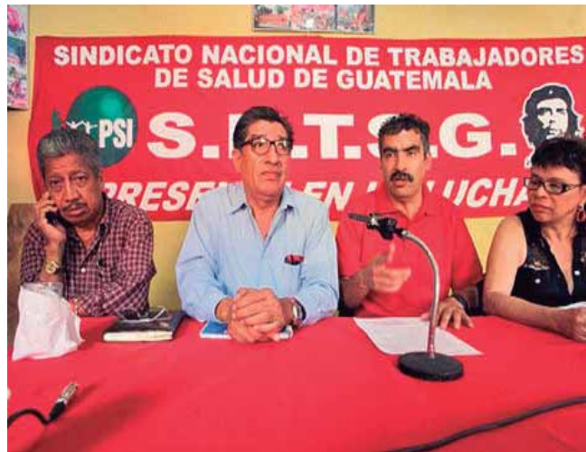
Dirigentes del Sindicato Nacional de Trabajadores de Salud

A pesar de que los hospitales siguen desabastecidos, el ministro de salud Jorge Villavicencio el mismo día de la manifestación afirmó en conferencia de prensa que el ministerio de salud cuenta con un abastecimiento del ochenta por ciento y que el problema radica en que las medicinas, insumos y vacunas son distribuidas en cantidades pequeñas por problemas de logística, a lo cual la vicepresidenta Baldetti agregó: "No puedo decir que la red hospitalaria está al cien por cien, porque eso sería mentirle, pero esto es la historia de 40 años de atraso en el sistema de salud" (Prensa Libre 29 8 14).