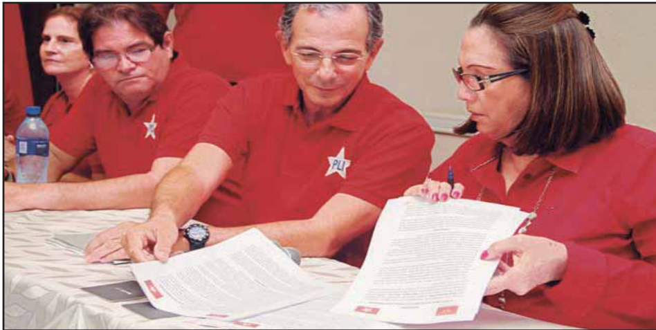
Nuevamente los liberales buscan su imposible unidad contra el FSLN