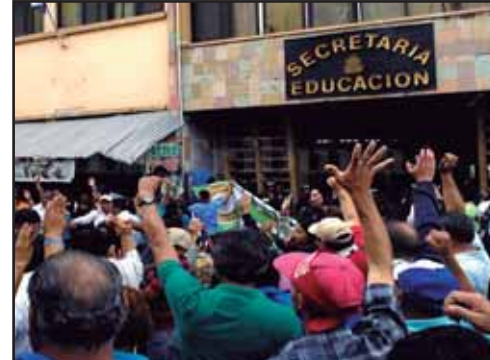
HONDURAS.- Celebramos el Día del Maestro con movilización