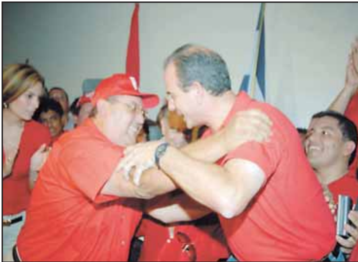
Abrazos y puñaladas en las pláticas pasadas

Contradictoriamente, la actual Ley Electoral no le impidió al FSLN imponer el régimen bonapartista, pero el problema es que ya no existe el otro componente del bipartidismo. La hegemonía del FSLN en la Asamblea Nacional, las alcaldías y las instituciones del Estado muestran claramente que pueden gobernar solos sin negociar con nadie, por el momento. El FSLN aspira a perpetuar esta situación