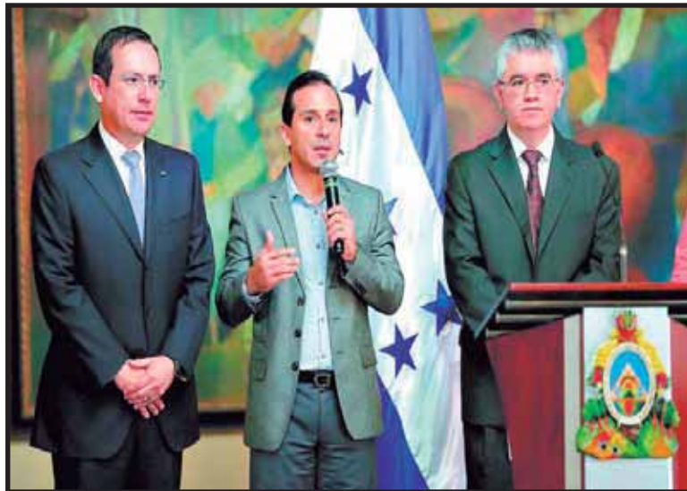
No hubo acuerdo con el FMI pero preparan las condiciones para que se firme en Noviembre

que ha venido haciendo el Fondo es sanear la empresa de energía, sin embargo, con la puesta en marcha de las térmicas los diferentes gobiernos descuidaron la empresa estatal y se inclinaron a fortalecer a las térmicas con la firma de contratos leoninos que se llevan la mayor tajada de los ingresos que se reciben de parte del abonado. Mientras la empresa privada