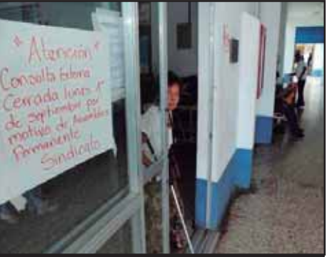
GUATEMALA.- Por un paro nacional de trabajadores de la salud