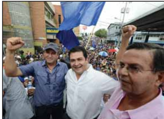
El Partido Nacional se muestra unido en la lucha por preservar el poder